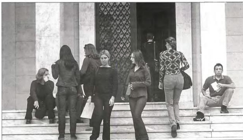
Αναβαθμίζεται το Διεθνές Πανεπιστήμιο, το οποίο θα συνδεθεί με τμήματα Ελληνικών Σπουδών πανεπιστημίων του εξωτερικού

Τα 94 συνολικά τμήματα σε Πανεπιστήμια και ΤΕΙ συγχωνεύονται ή απορροφώνται, καθώς είχαν χαμηλό βαθμό ενδιαφέ-