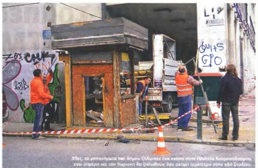
Χθες, τα μηχανήματα του δήμου Ξηλώνουν ένα κiosk στην Πλατεία Κουμουνδούρου. Σήμερα σιμπερά από την Κυριακή θα Ξηλωθούν δύο ακόμη περίπτερα στην οδό Σταδίου.

Τα πρώτα περίπτερα, πολύ μικρότερου μεγέθους σε σχέση με τα σημερινά, έκαναν την εμφάνισή τους στις αρχές του 20ού αιώνα και παραχωρούνταν σε αναπήρους πολέμου ως αντάλλαγμα για τις υπηρεσίες τους στην πατρίδα. Οι παραχωρήσεις συνεχίζονταν μαζί με τα θύματα των αλληπάλλων συρράξεων ενώ σταδιακά άρχισε να μεγαλώνει ο όγκος και να πληθαίνουν τα προϊόντα. Επίσης, άρχισαν οι επεκτάσεις έξω από το κουβούκλιο με ψυγεία, σταντ και άλλες εγκαταστάσεις. Παράλληλα, ίσχυαν περιορισμοί για τη δυνατότητα μεταβίβασης. Για παράδειγμα, η οικο-