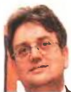
ΑΡΘΡΟ Του ΘΑΝΑΣΗ ΔΡΙΤΣΑ καρδιολόγου

Α πό την εποχή των επιδομάτων προς τους τριτέκνους περάσαμε πλέον στο αντίστροφο σενάριο, δηλ. στην εποχή της φορολογικής καταδίωξης όσων έχουν παιδιά. Είναι ενδιαφέρον να αναζητήσει κάποιος τη λογική αλλά και να αποδώσει την πρόποσα ηθική διάσταση στο παράλογο αυτό δεδομένο.