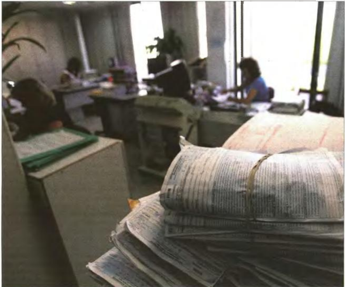
Υπάλληλοι της Εφορίας ελέγχουν φορολογικές δηλώσεις (φωτογραφία αρχείου)