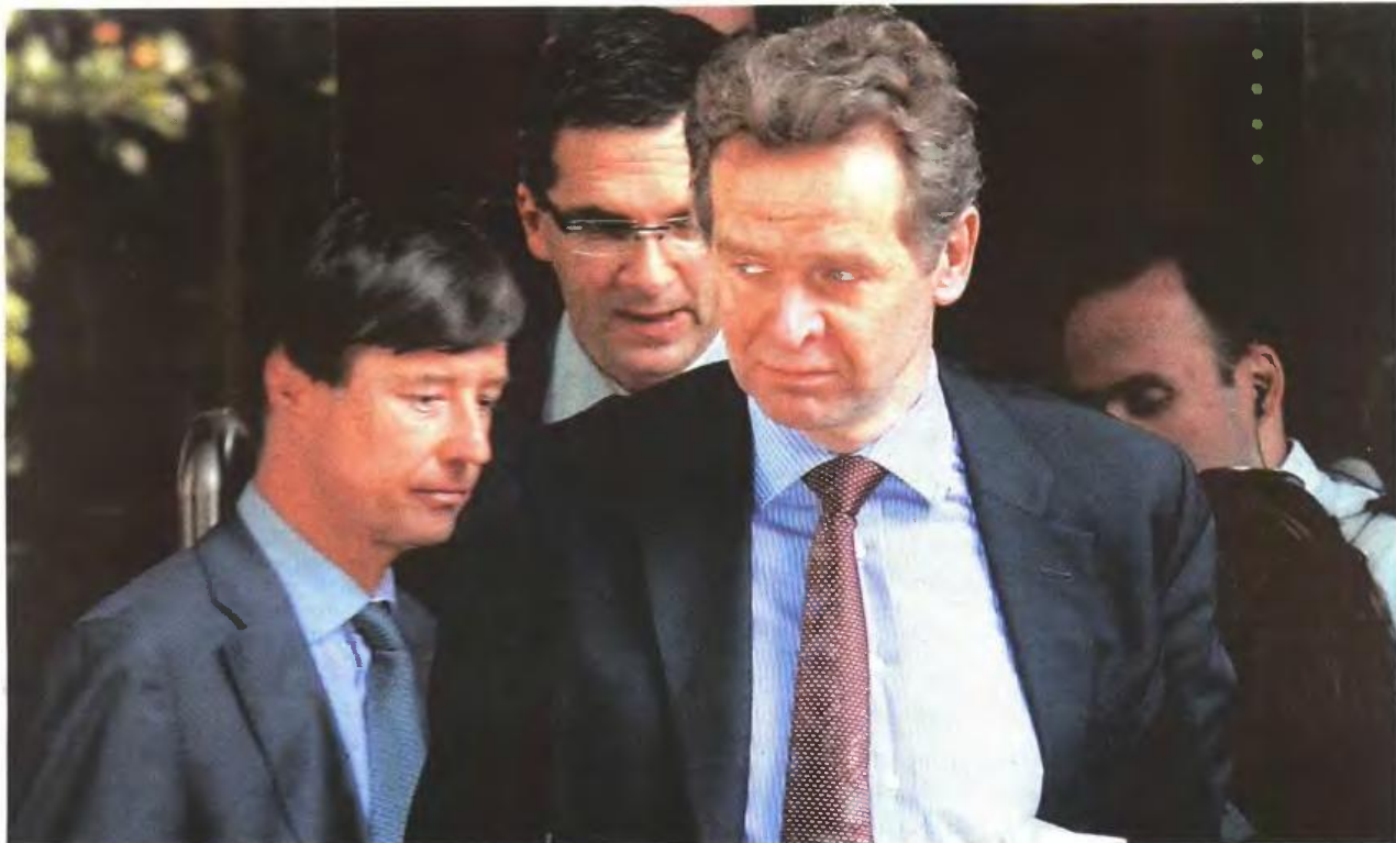
▲ ΤΗΝ ΕΠΟΜΕΝΗ ΕΒΔΟΜΑΔΑ φτάνουν στην Αθήνα οι Τόμσεν, Μαζούχ και Μορς. «Αγκάθι» στις σχέσεις της κυβέρνησης με τους δανειστές εξακολουθεί να παραμένει η κατάσταση στο Δημόσιο