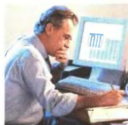
▲ ΣΤΟ ΥΠΟΥΡΓΕΙΟ Δικαιοσύνης προβλέπονται συνταξιοδοτήσεις 3.387 υπαλλήλων

Οι εξοικονομήσεις προέρχονται κυρίως από τη μείωση του μισθολογικού κόστους που προέρχεται από την περικοπή των θέσεων ευθύνης που αγγίζει το 51%, καθώς και από τη μεταστράτευση υπουργεί-