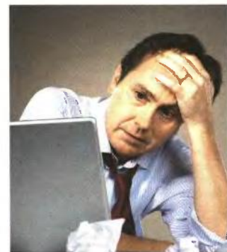
▲ ΝΕΟ ΠΟΝΟΚΕΦΑΛΟ προκαλεί στους φορολογουμένους η μείωση των επιδομάτων

Για τα επιδόματα αυτά δεν ισχύουν εισοδηματικά κριτήρια και ως εκ τούτου δεν είναι αναγκαίο το... τσεκάρισμα της φορολογικής δήλωσης.