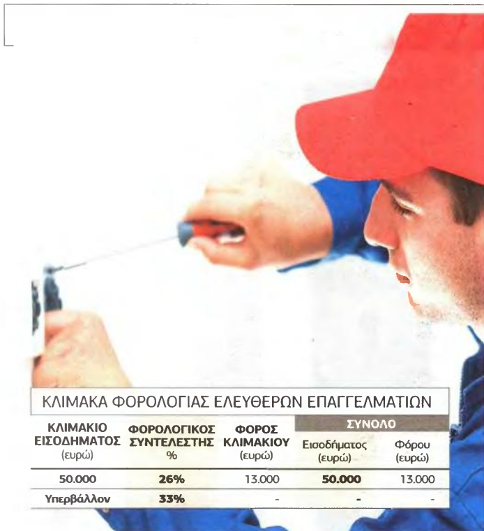
ΚΛΙΜΑΚΑ ΦΟΡΟΛΟΓΙΑΣ ΕΛΕΥΘΕΡΩΝ ΕΠΑΓΓΕΛΜΑΤΙΩΝ