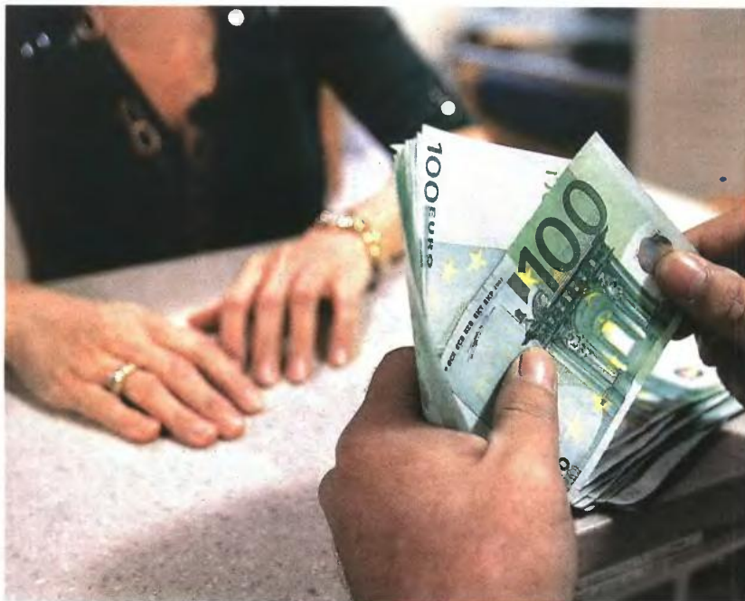
▲ Η ΑΥΞΗΣΗ του φορολογικού συντελεστή επί των τόκων αναμένεται να οδηγήσει σε πρόσθετα φορολογικά έσοδα 230 εκατ. ευρώ

Για μικροκαταθέτες άλλωστε, εκτιμούν οι ίδιες πηγές, οι επιβαρύνσεις είναι οριακές. Για παράδειγμα, σε τόκους καταθέσεων 500 ευρώ, η αύξηση του συντελεστή οδηγεί τον φόρο από τα 50 στα 75 ευρώ. Αντίθετα, για μεγαλοκαταθέτες οι επιβαρύνσεις είναι σημαντικές. Για παράδειγμα, αν κάποιος εισπράττει τόκους καταθέσεων 15.000 ευρώ ο φόρος αυξάνεται από 1.500 σε 2.250 ευρώ.