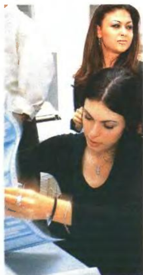
▲ ΓΙΑ ΤΟΥΣ ΝΕΟΥΣ επιπιδευματίες, κατά τα τρία πρώτα έτη άσκησης της δραστηριότητάς τους θα ισχύει μειωμένος φόρος στο 13% για τα πρώτα 10.000 ευρώ του ετήσιου εισοδήματος

ΕΠΙΠΛΕΟΝ ΦΟΡΟΥΣ , που φθάνουν στα 582 εκατ. ευρώ, φέρνει στις επιχειρήσεις η αύξηση των φορολογικών συντελεστών, ενώ από τη μείωση του φόρου στα μερίσματα το Δημόσιο θα έχει απόλλειες εσόδων 28 εκατ. ευρώ.