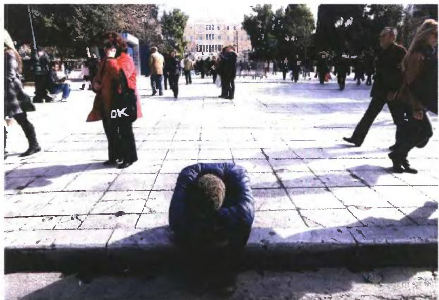
Απόγνωση, οργή, κατάθλιψη... Η εξαθλίωση στην οποία οδηγούνται όλο και μεγαλύτερα ποσοστά του πληθυσμού έχει αποτέλεσμα την πλήρη αποσύνθεση του κοινωνικού ιστού