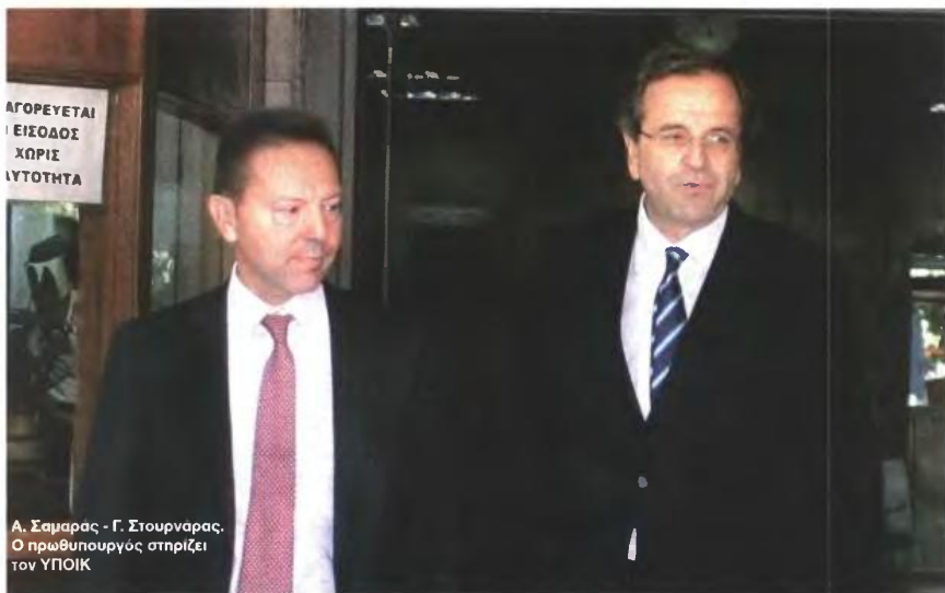
Α. Σαμαράς - Γ. Στουρνάρας. Ο πρωθυπουργός στηρίζει τον ΥΠΟΙΚ

Σε αυτά και δεκάδες ακόμα ερωτήματα ζητούν πειστικές απαντήσεις μια σειρά παράγοντες. Από τους απλούς πολίτες μέχρι τους οικονομικούς και παραγωγικούς φορείς της χώρας, από τους βουλευτές της κυβερνητικής πλειοψηφίας και τους πολιτικούς αρχηγούς μέχρι τον ίδιο τον πρωθυπουργό, που έχει ταυ-