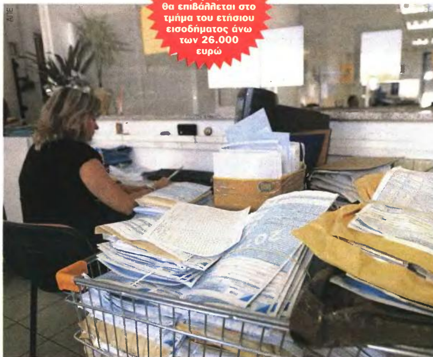
Ασήμαντες μεταβολές των φορολογικών επιβαρύνσεων από την τροποποιημένη πρόταση του Γ. Στουρνάρα.

✓ Σε ετήσιο εισόδημα από μισθούς ή συντάξεις ύψους 30.000 ευρώ, αντιστοιχεί φόρος 21% στις πρώτες 18.000 ευρώ, 26% στις επόμενες 8.000 ευρώ (δηλαδή στο τμήμα από τις 18.001 έως τις 26.000 ευρώ) και 45% στις επόμενες 4.000 ευρώ (δηλαδή από τις 26.001 έως τις 30.000 ευρώ). Ο συνολικός φόρος που αναλογεί με βάση την κλίμακα ανέρχεται, δηλαδή, στο ποσό των 7.660 ευρώ. Αφαιρούμενης της έκπτωσης των 1.950 ευρώ, ο τελικός φόρος διαμορφώνεται στις 5.710 ευρώ.