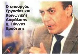
Ο υπουργός Εργασίας και Κοινωνικής Ασφάλισης κ. Γιάννης Βρούτσης

λει η ηλεκτρονική υποβολή της δήλωσης φορολογίας εισοδήματος (ΕΙ) του δικαιού-