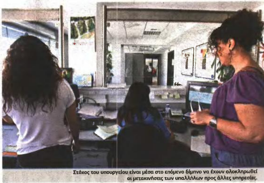
Στόχος του υπουργείου είναι μέσα στο επόμενο δίμηνο να έχουν ολοκληρωθεί οι μετακινήσεις των υπαλλήλων προς άλλες υπηρεσίες.

Στόχος του υπουργείου είναι μέσα στο επόμενο δίμηνο να έχουν ολοκληρωθεί οι μετακινήσεις τους προς άλλες υπηρεσίες. «Η καθυστέρηση συνεπάγεται μόνο μεγαλύτερη παραμονή στο καθεστώς της διαθεσιμότητας», σημειώνει. Παράλληλα, καθιστά σαφές πως η θέση σε αργία πειθαρχικά υπόλογων υπαλλήλων αφορά αποκλειστικά όσους έχουν παραπεμφθεί για σοβαρότατα ποινικά αδικήματα ή πειθαρχικά παραπτώματα. Δηλαδή, δεν αφορά τις υπόλοιπες πειθαρχικές υποθέσεις που εκκρεμούν, καθώς και τις απλές παραβάσεις του Υπαλληλικού Κώδικα (π.χ. απλή απείθεια, άρνηση παροχής πληροφόρησης, μη έγκαιρη απάντηση σε πολίτες, άρνηση ή παρέγκυση εκτέλεσης υπηρεσίας, παράβαση της αρχής της αμεροληψίας/ισότητας/εξουσίας). Λίγα εβδομάδες μετά την ψήφιση των σχετικών ρυθμίσεων, το υπουργείο Διοικητικής Μεταρρύθμισης προχώρησε στην παροχή διευκρινίσεων. Ειδικότερα: