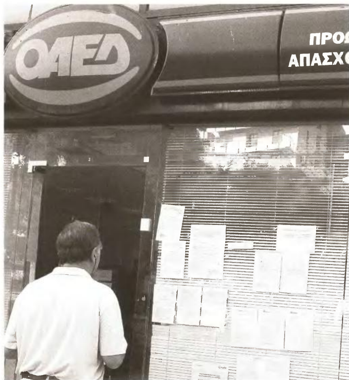
Τα τέσσερα προγράμματα του ΟΑΕΔ που βρίσκονται σε εξέλιξη αφορούν την επιχορήγηση επιχειρήσεων και γενικά εργοδοτών, καθώς και επιχειρήσεων Τοπικής Αυτοδιοίκησης α' και β' βαθμού, για τη δημιουργία θέσεων εργασίας

1. Άνεργοι, πρώην εργαζόμενοι ασφαλισμένοι στο ΙΚΑ-ΕΤΑΜ, ηλικίας 55-64 ετών, των