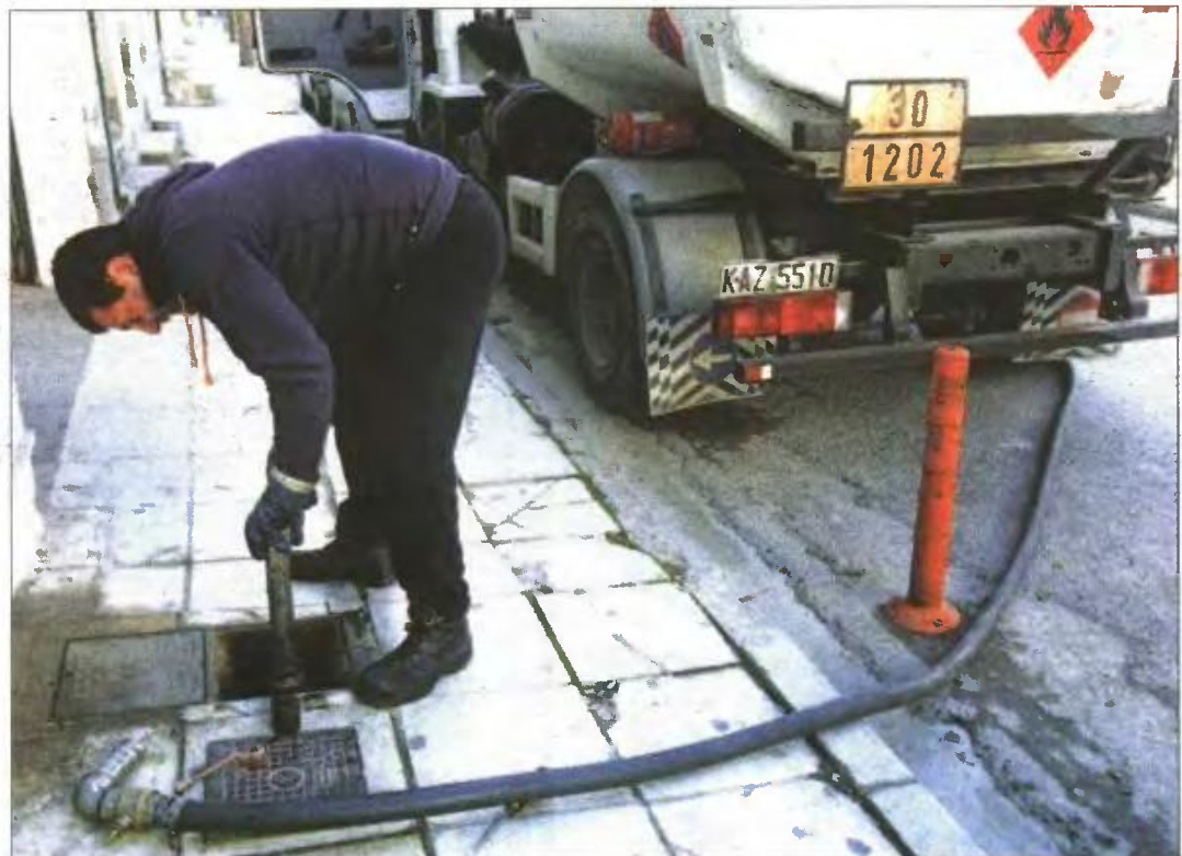
▲ Προσοχή στα «ψιλά γράμματα» ώστε να πάρουν όλοι οι δικαιούχοι το επίδομα για το πετρέλαιο θέρμανσης

3 Εάν κάποιος εμφανίζεται ως φιλοξενούμενος στη φορολογική δήλωση για το 2011, τότε δεν μπορεί να διεκδικήσει το επίδομα, καθώς το δικαιούται (εάν πληροί τα κριτήρια) αυτός που τον φιλοξενεί. Εάν όμως σταμάτησε να φιλοξενείται μέσα στο 2012, τότε πρέπει να το αναφέρει σε ειδικό παράθυρο στην εφαρμογή ώστε να διεκδικήσει το επίδομα.