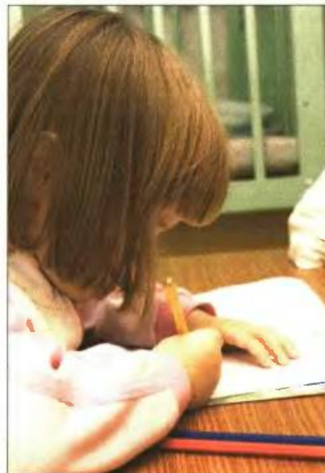
▲ Ομπρο των σκουπιδιών και πάλι οι κάτοικοι της χώρας. Προβλήματα και στους παιδικούς σταθμούς