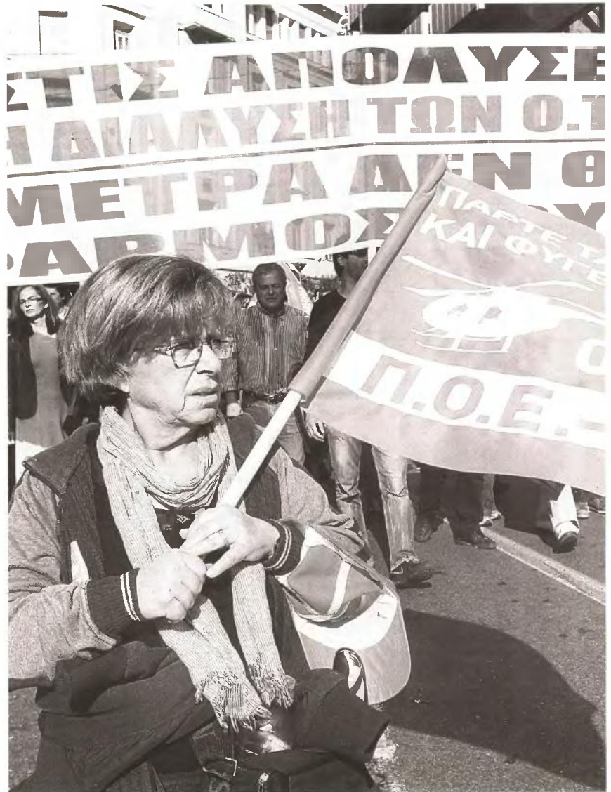
Δημοτικοί υπάλληλοι από διάφορους δήμους της Αθήνας και της περιφέρειας στο συλλαλητήριο που οργάνωσε η ΠΟΕ - ΟΤΑ πριν από λίγες ημέρες

Χαρακτηριστικά παραδείγματα διαφορετικής διαχείρισης και απλούς απόστασης των νοικοκυρεμένων από τους υπερχρεωμένους δήμους αποτελούν οι γειτονικοί πρώην δήμοι Νίκαιας και Ρέντη, που σήμερα συνιστούν ενιαίο δήμο. Σε αντίθεση με τον Ρέντη, που αποτελούσε παράδειγμα υγιούς δήμου πριν τον Καλλικράτη, η Νίκαια βούλιαζε στα χρέη με αποτέλεσμα τώρα ο νέος δήμος να βρίσκεται αντιμέτωπος με οφειλές 87 εκατ. ευρώ και δεκάδες εκκρεμείς δικαστικές υποθέσεις, η εκδίκαση των οποίων ενδέχεται να οδηγήσει σε μεγαλύτερο άνοιγμα.