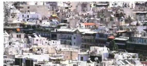
Η κλίμακα αυτοτελούς φορολόγησης των ενοικίων άλλαξε και πλέον προβλέπονται μόνο δύο κλίμακα.

Φόρος 20% στην υπεραξία από την πώληση ακινήτων, αμοιβαίων κεφαλαίων και μετοχών