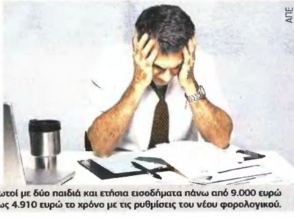
Οι μισθωτοί με δύο παιδιά και ετήσια εισοδήματα πάνω από 9.000 ευρώ θα επιβαρυνθούν με αυξήσεις φόρων από 50 έως 4.910 ευρώ το χρόνο με τις ρυθμίσεις του νέου φορολογικού.

τους οποίους θα έως 400 ευρώ σε επιβαρύνσεις. Αντί οι συνταξιούχοι και εισοδήματα άνω των 25.000 ευρώ θα επιβαρυνθούν με αυξήσεις φόρων από 140 έως και 4.510 ευρώ λόγω της κατάργησης των πρόσθετων αφορολογίτων ορίων για τα προστατευόμενα τέκνα: • οι μισθωτοί με εισοδήματα πάνω επιβαρυνθούν με αυξήσεις φόρων από 70 έως 4.710 ευρώ το χρόνο. • οι μισθωτοί με εισοδήματα πάνω επιβαρυνθούν με αυξήσεις φόρων από 50 έως 4.910 ευρώ