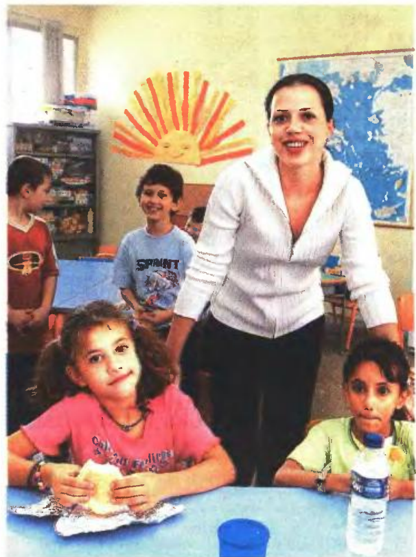
Ο νηπιαγωγός -μετά τους γονείς- είναι το βασικό πρόσωπο που διαδραματίζει καθοριστικό ρόλο στη διαπαιδαγώγηση και κοινωνικοποίηση του παιδιού

Καθώς έχει μεγαλύτερη σημασία «η γνώση των τρόπων πρόσβασης στη γνώση» κι όχι η κατανάλωση «καθιερωμένων» γνώσεων, παρέχεται η δυνατότητα, ώστε ένα μέρος των σπουδών να γίνει μέσα από ειδικά σχεδιασμένα, χρονικά περιορισμένα ερευνητικά προγράμματα. Διερευνώντας πραγματικά προβλήματα, σε άμεση επαφή με τους/τις διδάσκοντες/ουσες, οι φοιτητές και