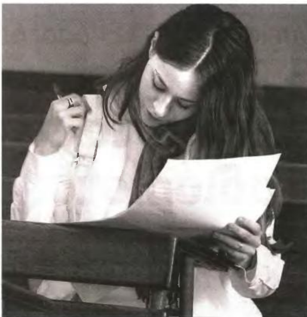
Την περσινή χρονιά, 7 στους 10 υποψηφίους που είχαν δηλώσει στην κορυφή των προτιμήσεών τους ένα από τα 9 τμήματα νηπιαγωγών ή προσχολικής αγωγής κατάφεραν να εισαχθούν

Για τον λόγο αυτόν οι νέοι άνθρωποι που επιθυμούν να κάνουν αυτές τις σπουδές παρά τις δυσκολίες που υπάρχουν, στρέφουν το βλέμμα τους στα μεταπτυχιακά και κυρίως σε ότι αφορά την ειδική αγωγή, καθώς αποτελεί ένα καλό διαβατήριο για την εύρεση εργασίας κυρίως στο εξωτερικό αλλά και στην Ελλάδα. Την