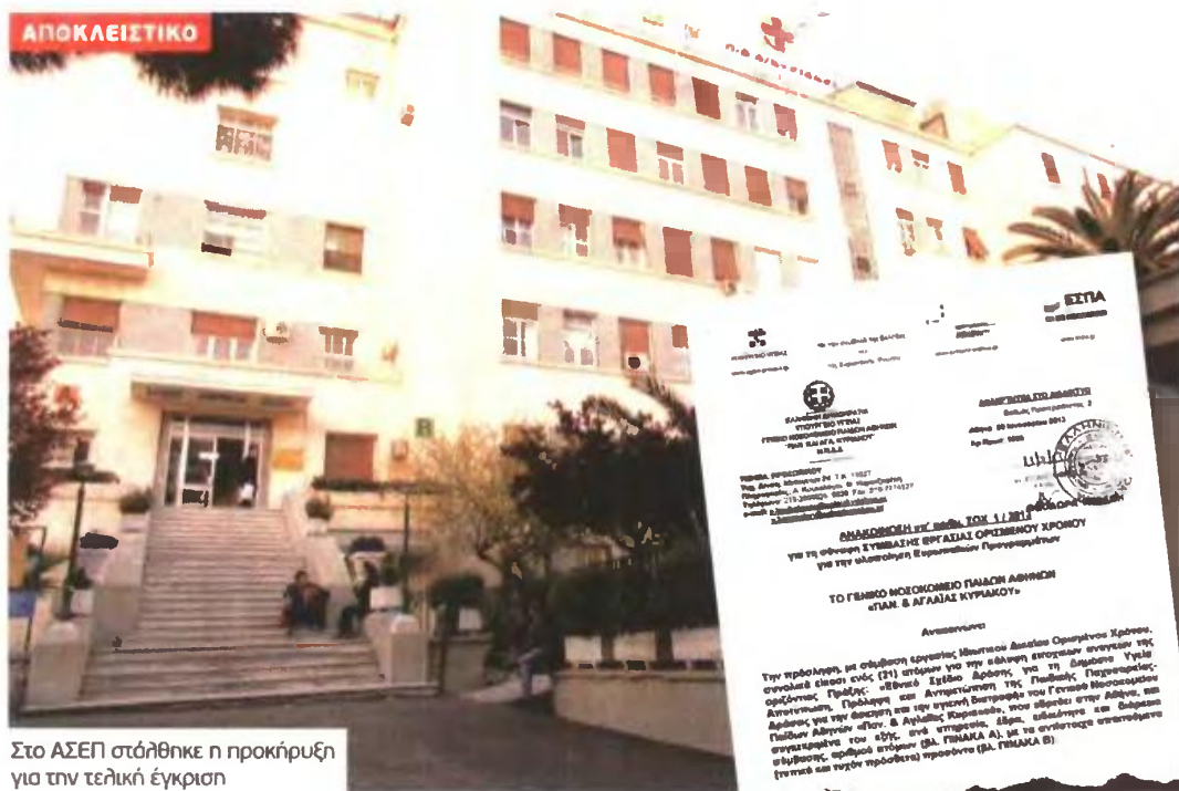
Στο ΑΣΕΠ στάθηκε η προκήρυξη για την τελική έγκριση

Ζητούνται νοσηλευτές, γυμναστές, διατροφολόγοι, επισκέπτες Υγείας, διοικητικό προσωπικό και λογιστές