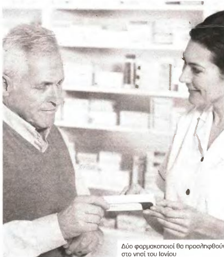
Δύο φαρμακοποιοί θα προσληφθούν στο νησί του Ιονίου

Δυνατότητα συμμετοχής στο διαγωνισμό έχουν οι άνεργοι ηλικίας έως 30 ετών. Η κατανομή των θέσεων είναι η εξής: ΠΕ-ΤΕ Νοσηλευτών 2, ΠΕ Ιατρών 1, ΠΕ Κοινωνικών Επιστημών/ΤΕ Κοινωνικών Λειτουργιών 6, ΥΕ Βοηθητικού Προσωπικού Καθαριότητας 4, ΠΕ-ΤΕ-ΔΕ Διοικητικού 4, ΔΕ Μαγειρών 3, ΠΕ-ΤΕ Φαρμακοποιών 2, ΠΕ-ΤΕ Γεωπόνων 1, ΥΕ Επιστατών 1 και ΠΕ-ΤΕ Τεχνολόγων Τροφίμων, Τυποποίησης και Διαχείρισης Προϊόντων 3. Οι ενδιαφερόμενοι για τις θέσεις των κοινωνικών λειτουργιών πρέπει να διαθέτουν πτυχίο ΑΕΙ ή ΤΕΙ αντίστοιχης ειδικότητας, άδεια άσκησης επαγγελματος κοινωνικής εργασίας, γνώση χειρισμού ηλεκτρονικού υπολογιστή στα τρία βασικά αντικείμενα (επεξεργασία κειμένων, υπολογιστικών φύλλων και