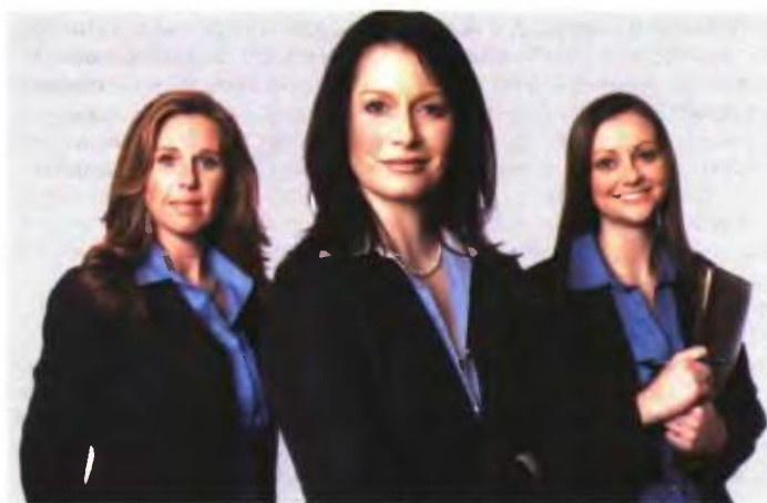
Στόχος ενός από τα προγράμματα είναι η ενίσχυση επιχειρηματικών σχεδίων που θα αναληφθούν από άνεργες γυναίκες.

Το ποσοστό της επιχορήγησης θα κυμαίνεται μεταξύ του 40% έως 60% και καθορίζεται ανάλογα με την περιφέρεια που θα έχει έδρα η επιχείρηση. Σημειώνεται ότι στη βαθμολογία επιλογής των ανέργων θα υπάρχει προμείωση στις περιπτώσεις ανέργων με τέκνα, ΑμΕΑ,