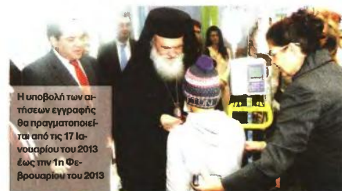
Η υποβολή των αι-τήσεων εγγραφής θα πραγματοποιεί-ται από τις 17 Ια-νουαρίου του 2013 έως την 1η Φε-βρουαρίου του 2013