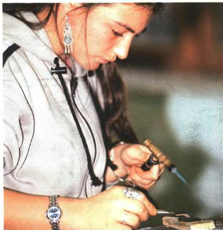
Η κατασκευή χειροποίητων αντικειμένων είναι ένας ολοένα αναπτυσσόμενος κλάδος που αποδίδει ένα ικανοποιητικό εισόδημα

► Μπορείτε να παρακολουθήσετε σεμινάρια που διοργανώνονται από διάφορους φορείς, αλλά και εργαστήρια, ώστε να αποκτήσετε την κατάρτιση