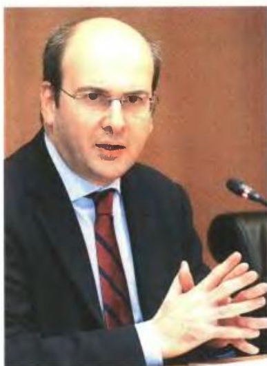
▲► Ο ΥΠΟΥΡΓΟΣ ΑΝΑΠΤΥΞΗΣ Κωστής Χατζηδάκης έχει ετοιμάσει και παρουσιάζει από το περασμένο φθινόπωρο τα δύο νομοσχέδια, ωστόσο η τρόικα... βάζει εμπόδια παρότι πιέζει για γρήγορες αλλαγές

Μάλιστα, όπως αναφέρουν έγκυρες πηγές στο «Έθνος», τα δύο νομοσχέδια δεν