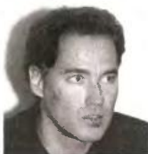
ΤΣΙΤΣΕΛΙΚΗΣ Πάρε θέση

Με την αναθεώρηση του 2001, με ευρύτατη πλειοψηφία, εισήχθη πρώτο στο άρθρο 25 παρ. 1 η αρχή του κοινωνικού κράτους και επιληπθέντες αιχμηρότερές διατάξεις για τη δημογραφική πολιτική, τα δικαιώματα των ανηπίων, τη δυνατότητα λήψης θετικών μέτρων για την άρση ανισοτήτων ως βάρος των γυναικών και άλλων ομάδων. Ο νομοθέτης και η νομολογία έχουν το συνταγματικό υποχρέωση να εφαρμόσουν, να εξειδικεύσουν, να αναπτύξουν τις συνταγματικές αυτές αρχές. Ασφαλώς δεν είναι δυνατό να περιμένουμε από το Σύνταγμα την αντιμετώπιση όλων των προσδοκίων μας ή να φερόμαστε στο Σύνταγμα την αδυναμία της πολιτικής εξουσίας να εφαρμόσει πολιτικές που ν' ανταποκρίνονται στις προσδοκίες μας. Εντούτοις θεωρούμε ότι έχει μεγάλη αξία να θεσπίσει ο αναθεωρητικός νομοθέτης διατάξεις στο Σύνταγμα για την περαιτέρω εξειδίκευση του άρθρου 21 παρ. 5, δηλαδή της αρχής του κοινωνικού κράτους. Συμβολική και ταυτοχρόνια προπαινετική ενέργεια θα ήταν επίσης η προσηλυτική Προοιμίου στο αναθεωρημένο Σύνταγμα, που θα κατοχυρώνει την αναγκαία ισορροπία του κοινωνικού κράτους και του κράτους δικαίου, δεδομένου ότι ζούμε σε εποχή με ορατές τις δυσμενείς συνέπειες στην κοινωνική συνολική (φτωχοποίηση, Εγκληματικότητα, ρατσιστικές επιθέσεις, κοινωνικός αυτοματισμός).