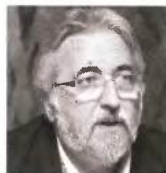
ΠΑΝΑΓΟΠΟΥΛΟΣ Πάρε θέση

Του ΚΩΝΣΤΑΝΤΙΝΟΥ ΤΣΙΤΣΕΛΙΚΗ αναπληρωτή καθηγητή στο Παν. Μακεδονίας, προέδρου της Ελληνικής Ενωσης για τα Δικαιώματα του Ανθρώπου