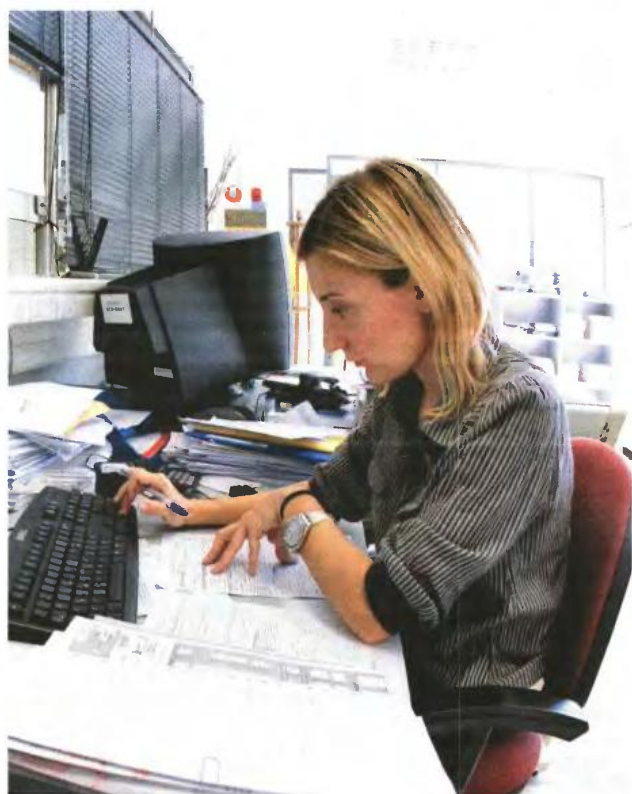
▲ ΜΕ ΤΗΝ ΕΦΑΡΜΟΓΗ του ηλεκτρονικού περιουσιολογίου η Εφορία θα έχει αναλυτικά στοιχεία για την κινητή και ακίνητη περιουσία όλων των Ελλήνων

Οι φορολογούμενοι θα κληθούν να δηλώσουν καταθέσεις στις τράπεζες, τοποθετήσεις σε μετοχές, ομόλογα και αμοιβαία κεφάλαια, κατοικίες, αγροτεμάχια, κινητά περιουσιακά στοιχεία (ΙΧ αυτοκίνητα, σκάφη αναψυχής κ.λπ.).