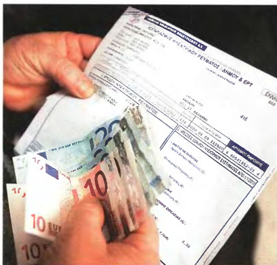
▲ ΣΤΑ ΚΑΤΑΣΤΗΜΑΤΑ της ΔΕΗ διανέμεται μόνο ενημερωτικό υλικό και δεν υποβάλλονται αιτήσεις για το Κοινωνικό Τιμολόγιο

■ Ατομα που χρήζουν μηχανικής υποστήριξης: Ατομα που χρησιμοποιούν μηχανική υποστήριξη ή άτομα που τα βαρύνουν προστατευόμενα μέλη που χρησιμοποιούν μηχανική υποστήριξη, με ετήσιο οικογενειακό εισόδημα μικρότερο από το ποσό των 30.000 ευρώ και με τετραμηνιαία κατανάλωση από 200 kWh. Οι καταναλώσεις, πέραν των 2.000 kWh, θα τιμολογούνται με το οικιακό τιμολόγιο ΔΕΗ, όπως ισχύει κάθε φορά.