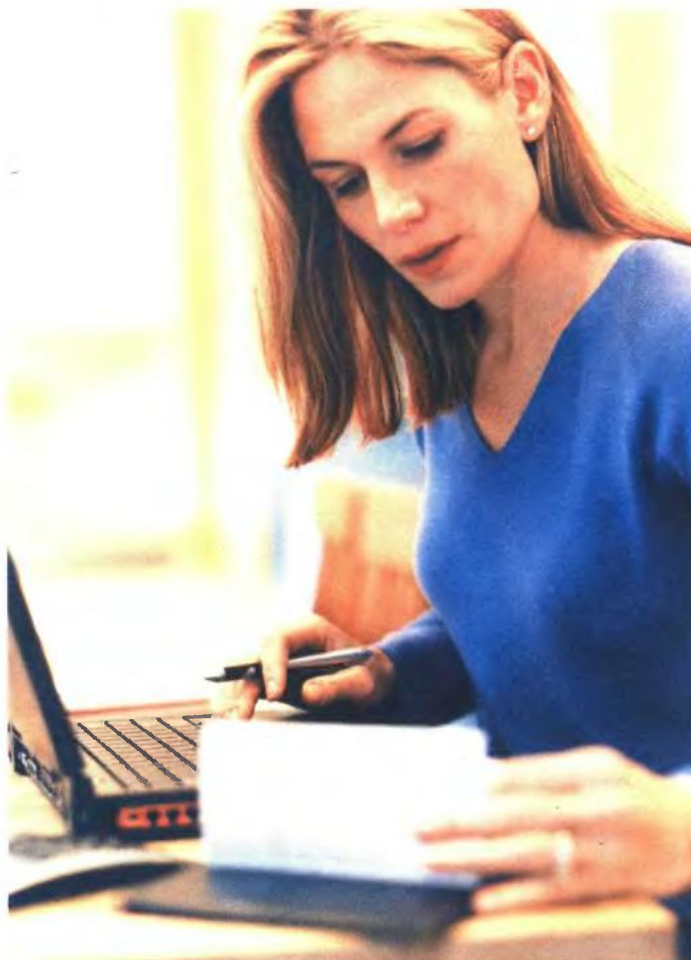
▲ ΤΟ ΣΧΕΔΙΟ για την επιβολή του νέου ενιαίου φόρου στα ακίνητα, καθώς και οι αλλαγές στη φορολογία των μεταβιβάσεων ακινήτων θα προβλέπονται στο επόμενο νομοσχέδιο της φορολογικής μεταρρύθμισης, το οποίο αναμένεται να είναι έτοιμο εντός του Μαΐου

■ Αγροτεμάχια. Ο νέος φόρος θα επιβαρύνει όλα τα αγροτεμάχια καθώς και τα οικοπέδα εκτός σχεδίου. Η επιτροπή προτείνει να υπάρξει ειδική μέριμνα για τα αγροτεμάχια της Αττικής τα οποία έχουν πολύ υψηλή αντικειμενική αξία, διευρύνοντας τις επιβαρύνσεις και αποθαρρύνοντας την αγροτική παραγωγή εντός Αττικής. Γι' αυτό τον λόγο εξετάζεται για τα αγροτεμάχια της Αττικής και για ορισμένες άλλες περιοχές της χώρας να υπάρξουν συντελεστές απομείωσης της αντικειμενικής αξίας.