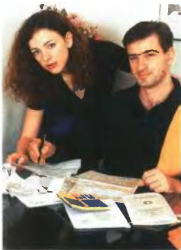
▲ ΟΣΟΙ ΔΕΝ ΚΑΤΑΦΕΡΑΝ να μαζέψουν τις απαιτούμενες αποδείξεις, θα κληθούν να πληρώσουν έξτρα φόρο 10%

Α ναλυτικό οδηγό με τη μορφή ερωταπαντήσεων για τη φορολογική κλίμακα, τις αφορολόγητες δαπάνες, τα δικαιολογητικά και τη συλλογή αποδείξεων που ισχύουν για τα εισοδήματα του 2012 που θα δηλωθούν φέτος από μισθωτούς, συνταξιούχους, ελεύθερους επαγγελματίες, αγρότες και εισοδηματίες εξέδωσε το υπουργείο Οικονομικών. Στόχος να αποφευχθούν λάθη και παραλείψεις στη συμπλήρωση της φορολογικής δήλωσης