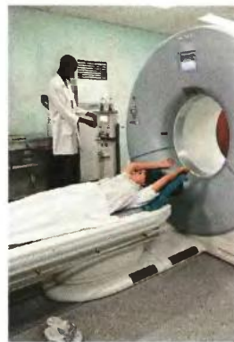
▲ ΓΙΑ ΤΑ ΝΟΣΗΛΙΑ χρειάζεται διπλότυπη απόδειξη της κλινικής, από την οποία να προκύπτει το ποσό της δαπάνης για τη νοσηλεία του ασθενούς

Για την απόδειξη της καταβολής απαιτείται διπλότυπη απόδειξη, η οποία εκδίδεται από τον ιατρό κατά την είσπραξη της αμοιβής. Για την αναγνώριση της δαπάνης για λογοθεραπεία και για ψυχολόγο, εκτός από τη γνωμάτευση του γιατρού, απαιτείται και βεβαίωση του γιατρού ότι έλαβε υπόψη του τα πορίσματα του ψυχολόγου ή λογοθεραπευτή για την παροχή των τελικών υπηρεσιών του.