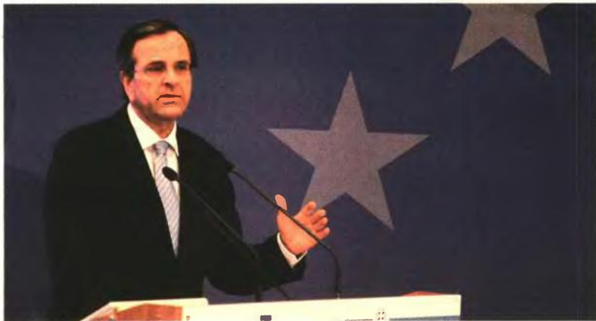
Σήμερα στο Μέγαρο Μαξίμου