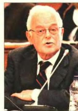
➤ Από το υπουργείο Διοικητικής Μεταρρύθμισης εκπέμπονται θετικά μηνύματα αναφορικά με τη στάση των ελεγκτών

Στη διαδικασία αυτή θα συμβάλει η ολοκλήρωση της αξιολόγησης των δομών των φορέων που βρίσκονται κάτω από τη γενική κυβέρνηση: Δήμοι, ασφαλιστικά ταμεία, νοσοκομεία, πανεπιστήμια, ενώ θα έχει ολοκληρωθεί και η διαδικασία των