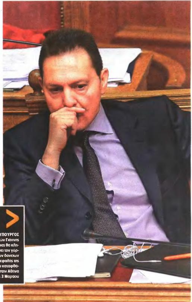
Ο ΥΠΟΥΡΓΟΣ Οικονομικών Γιάννης Κατσιάρης θα κληθεί να λύσει τον γορδιο δεσμό των δανειών με τους επικεφαλής της τρόικας που καταφθάνουν στην Αθήνα στις 3 Μαρτίου

Με το ίδιο πνεύμα για όλες τις ρυθμίσεις των οφειλών (του Δημοσίου προς τους ιδιώτες αλλά και των χρεών που έχουν οι φορολογούμενοι προς το Δημόσιο και τα ασφαλιστικά ταμεία) καταφθάνει αυτή την εβδομάδα η τρόικα στην Αθήνα, τα τεχνικά κλιμάκια της οποίας αρχίζουν από την Τρίτη συζητήσεις με τους τεκνοκράτες του υπουργείου Οικονομικών. Τα κλιμάκια των πιστωτών της χώρας θα παραμείνουν στην Ελλάδα για τις επόμενες τρεις εβδομάδες αλλά από τις 3 Μαρτίου θα αναλάβουν δράση οι επικεφαλής της τρόικας (Πόουλ Τόμσον του ΔΝΤ, Ματίας Μορς της Κομισιόν και Κλάους Μαζούχ της Ευρωπαϊκής Κεντρικής Τράπεζας). Σύμφωνα με πληρο-