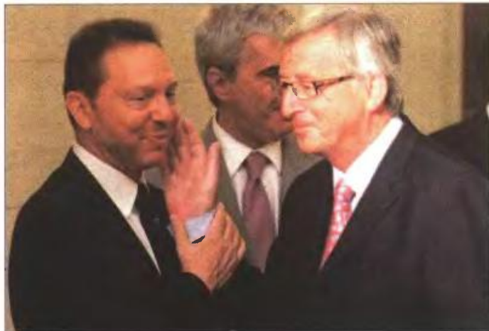
▲ Ο υπουργός Οικονομικών Γιάννης Στουρνάρας με τον επικεφαλής του Eurogroup Ζαν Κλοντ Γιούνκερ