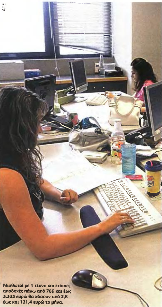
Μισθωτοί με 1 τέκνο και ετήσιες αποδοχές πάνω από 786 και έως 3.333 ευρώ θα χάσουν από 2,8 έως και 121,4 ευρώ το μήνα.

100 ευρώ ή μηνιαίες αποδοχές κω από 679 ευρώ.