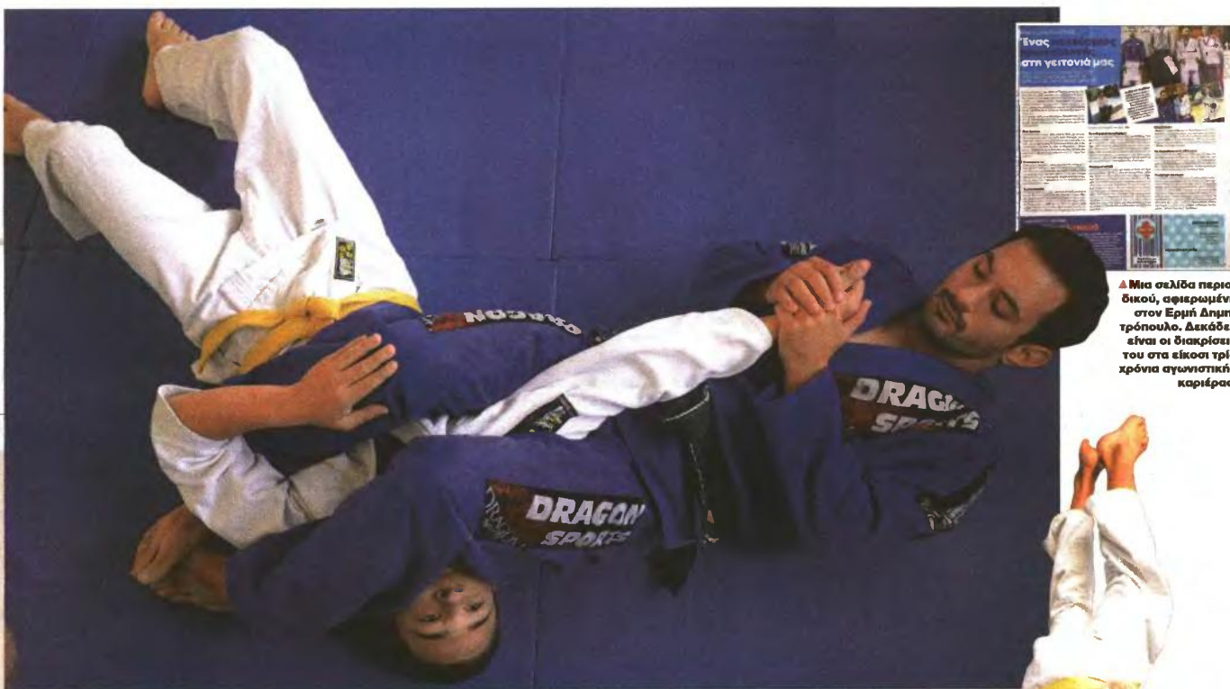
▲ Μια σελίδα περιοδικού, αφιερωμένη στον Ερμή Δημητρόπουλο. Δεκάδες είναι οι διακρίσεις του στα είκοσι τρία χρόνια αγωνιστικής καριέρας.