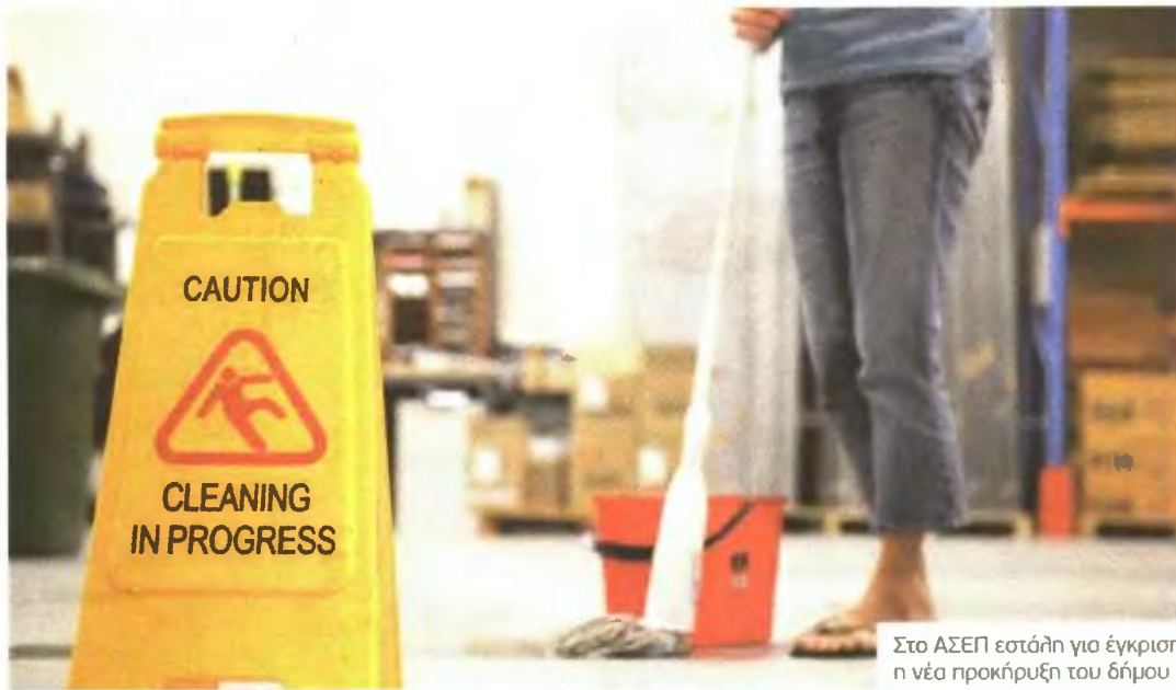
Στο ΑΣΕΠ εστάλη για έγκριση η νέα προκήρυξη του δήμου