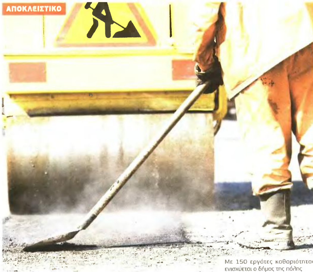
Με 150 εργάτες καθαριότητας ενισχύεται ο δήμος της πόλης