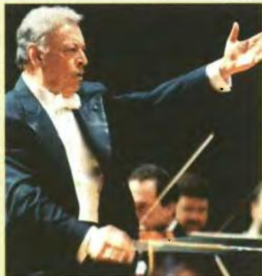
Ο αρχιμουσικός Ζούμπιν Μέτα