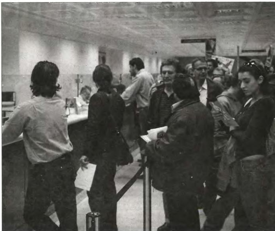
Κύκλοι της κυβέρνησης ανέφεραν ότι η όλη διαπραγμάτευση βρίσκεται σε κομβικό σημείο και ότι οι αντιδράσεις της τρόικας είναι αντιμετωπίσιμες.

ότι η όλη διαπραγμάτευση βρίσκεται σε κομβικό σημείο και ότι οι αντιδράσεις της τρόικας είναι αντιμετωπίσιμες.