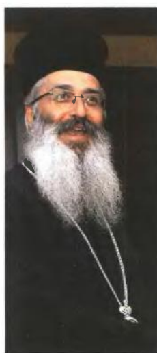
Ο μητροπολίτης Αλεξανδρουπόλεως, Ανθιμος.

το αύξησε ο έντονος, βαθύς και απότομος πλουτισμός», εξηγεί ο πατέρας Γεώργιος.