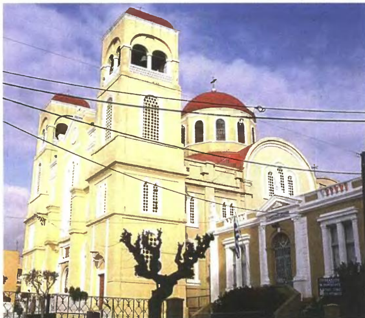
Η Μητρόπολη Αλεξανδρουπόλεως όπου επιτελείται σπουδαίο κοινωνικό έργο.

«Τα προβλήματα πάντοτε έχουν το χρώμα της ηλικίας και της κατάστασης. Οι εξώγαμες σχέσεις είναι εκείνο που μας πονάει περισσότερο. Το πρόβλημα των εξώγαμων σχέσεων ίσως και να