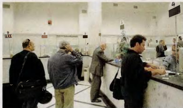
Σε ό,τι αφορά τις τράπεζες, οι ρυθμίσεις στεγαστικών και καταναλωτικών δανείων μέχρι σήμερα έχουν ξεπεράσει τις 700.000.

Να σημειωθεί ότι οι προϋποθέσεις σε σχέση με τους δικαιούχους ένταξης θα πρέπει να συντρέχουν σωρευτικά. Όσοι πληρούν αυτές τις προϋποθέσεις, θα απαλλαγούν από την υποχρέωση αποπληρωμής κεφαλαίου και θα καταβάλλουν για δύο χρόνια (με δυνατότητα παράτασης για άλλα δύο) μόνο τόκους με χαμηλό επιτόκιο 1,5%.