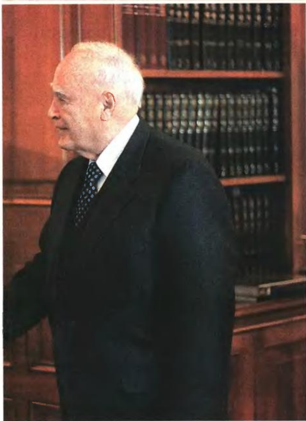
◀ ΠΛΗΓΗ για τη χώρα χαρακτήρισε τη φοροδιαφυγή ο Πρόεδρος της Δημοκρατίας, Κ. Παπούλιας