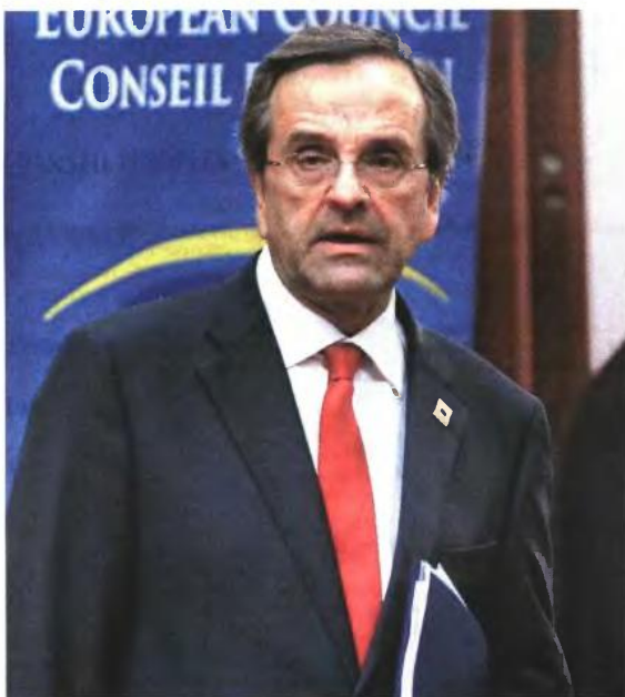
▲ Ο Α. ΣΑΜΑΡΑΣ θα έχει ίσως και εντός της ημέρας τηλεφωνικές επικοινωνίες με τους κυβερνητικούς του εταίρους, προκειμένου να τους ενημερώσει για την πρόταση του υπ. Οικονομικών και να τους ζητήσει να συναινέσουν