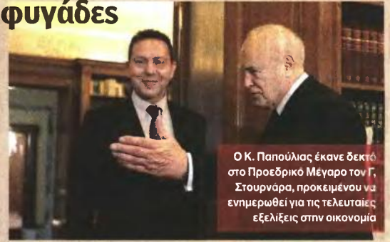
Ο Κ. Παπούλιας έκανε δεκτό στο Προεδρικό Μέγαρο τον Γ. Στουρνάρα, προκειμένου να ενημερωθεί για τις τελευταίες εξελίξεις στην οικονομία

νει στην Αμερική. Είτε δηλαδή «θα συμβιβάζεσαι και θα πληρώνεις», εξήγησε, «είτε θα πηγαίνεις φυλακή». Ο Πρόεδρος της Δημοκρατίας χαρακτήρισε πληγή για τη χώρα τη φοροδιαφυγή, τονίζοντας πως η αντιμετώπισή της πρέπει να γίνει εθνικός στόχος, ενώ ο υπουργός Οικονομικών δεσμεύθηκε ότι αμέσως μετά τη διευθέτηση των εκκρεμοτήτων με τη δόση όλη η έμφαση θα δοθεί στο πεδίο αυτό.