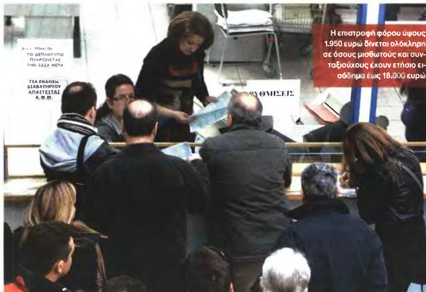
Η επιστροφή φόρου ύψους 1.950 ευρώ δίνεται ολόκληρη σε όσους μισθωτούς και συνταξιούχους έχουν επίσης εισόδημα έως 18.000 ευρώ

“ Αναμένεται να διατηρηθεί η ισχύουσα φορολογική κλίμακα με την οποία ο ανώτατος φορολογικός συντελεστής 45% επιβάλλεται στο τμήμα του εισοδήματος άνω των 100.000 ευρώ