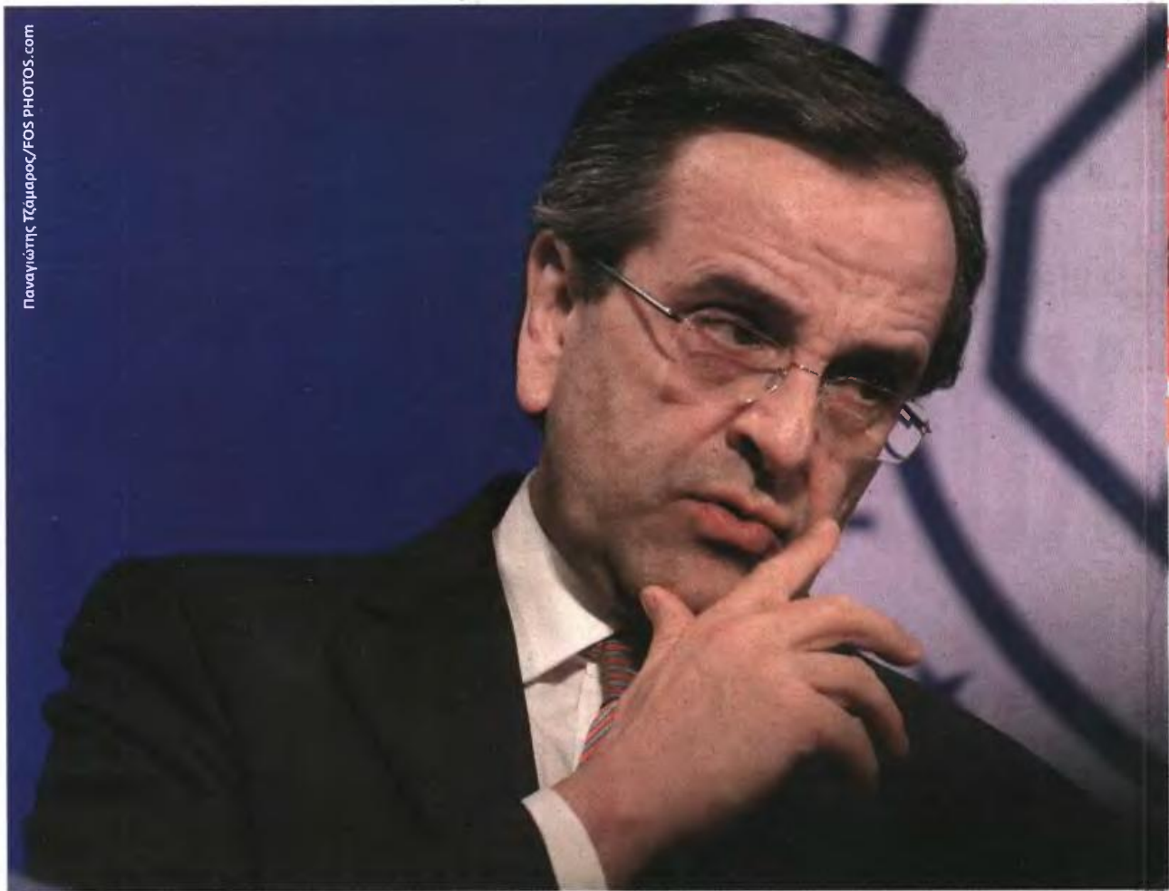
Παναγιώτης Τζαμαρός/FOS PHOTOS.com