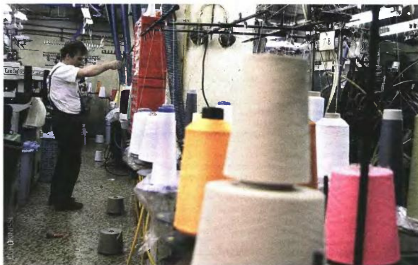
Αυξάνεται στα 550-650 € (από 500 €) το τέλος επιτηδεύματος για εμποροβιοτέχνες και ελεύθερους επαγγελματίες.

Σοκ για 1 εκατ. επιτηδευματίες. Βελτιώσεις στην κλίμακα φορολογίας για μισθούς και συντάξεις