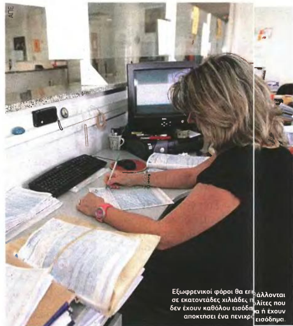
Εξωφρενικοί φόροι θα επιβάλλονται σε εκατοντάδες χιλιάδες πολίτες που δεν έχουν καθόλου εισόδημα ή έχουν αποκτήσει ένα πενιχρό εισόδημα.

Αρα η συγκεκριμένη γυναίκα που δεν έχει καθόλου εισόδημα θα πληρώσει φόρο 2.172,20 ευρώ σαν να ήταν «επιτυχεματίας», με το νέο φορολογικό νομοσχέδιο που προωθεί η ηγεσία του υπ. Οικονομικών.