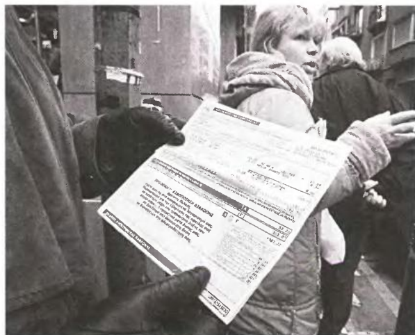
Οι καταναλωτές θα πληρώσουν το μάρμαρο και πάλλι...

κλιμάκια καταναλώσεως και σε ένα «τσουβάλλι» με ακριβό τιμολόγιο μπαίνουν όλοι όσοι καταναλώνουν από 800 έως και 2.000 κιλοβατώρες. Πέρυσι υπήρχε και ενδιάμεσο κλιμάκιο για καταναλωτές 800 έως 1.000 κιλοβατωρών.