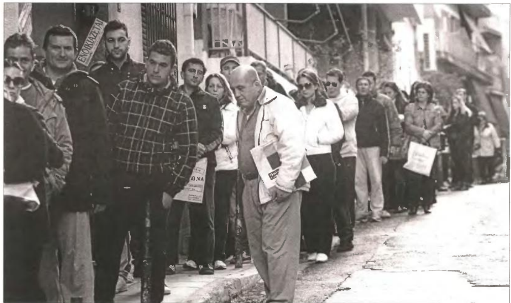
Ουρά από ανέργους, που περιμένουν καρτερικά έξω από γραφείο του ΟΑΕΔ

■ Ελεύθεροι επαγγελματίες: Στην κατηγορία αυτή συγκαταλέγονται όσοι μικρομεσαίοι έβαλαν λουκέτο στα μαγαζιά τους. Υπολογίζεται ότι ως τώρα έχουν κλείσει πάνω από 70.000 μικρά