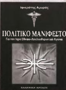
Κυκλοφορεί το "Πολιτικό Μανιφέστο" του Ιφικράτη Αμυρά (εκδ. "Ελληνική Άνοδος"). Ένα βιβλίο για τον Ιερό ΕθνικοΑπελευθερωτικό Αγώνα.