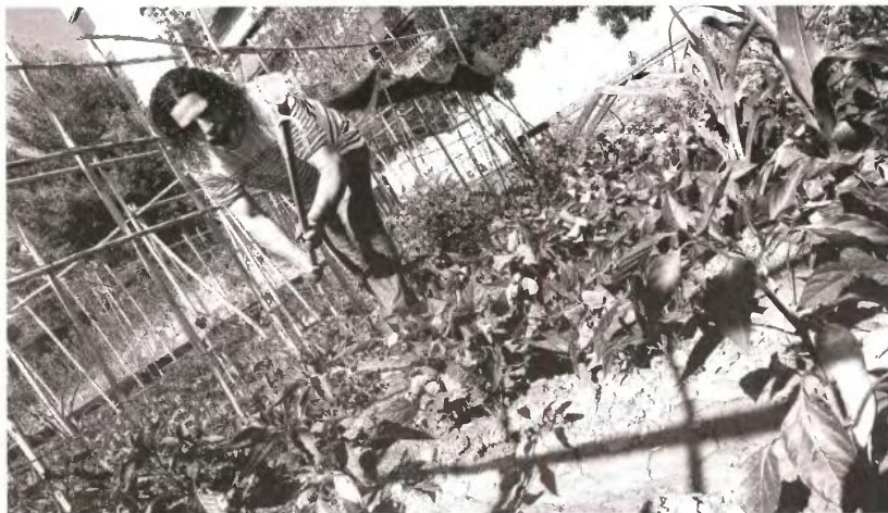
Στους λαχανόκηπους των 51 δήμων που συμμετέχουν στο πρόγραμμα θα υπάρχουν τρεις απασχολούμενοι και ειδικότερα ένας γεωπόνος για την υποστήριξη - συμβουλευτική των ωφελουμένων, ένας επιστάτης του αγροκτήματος και ένας κοινωνικός λειτουργός

Στα Κοινωνικά Φαρμακεία θα τοποθετηθούν δύο φαρμακοποιοί