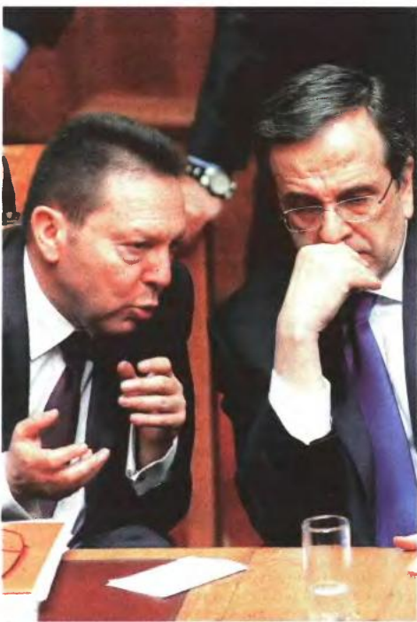
▲ ΣΤΗ ΣΥΝΑΝΤΗΣΗ που θα έχει αύριο με τους εκπροσώπους της τρόικας, ο Α. Σαμαράς (στη φωτογραφία με τον Γ. Στουρνάρα) θα ζητήσει αλλαγές σε τρία βασικά σημεία του Μνημονίου

Τέλος, στην αυριανή συνάντηση θα γίνει ειδική αναφορά στο θέμα της μείωσης του κράτους, καθώς ο πρωθυπουργός πιστεύει ότι οι στόχοι που έχουν τεθεί μπορούν να επιτευχθούν με τη διαθεσιμότητα, την αποσομίηση των επιορκων δημοσίων υπαλλήλων και το πρόγραμμα συγχωνεύσεων - καταργήσεων οργανισμών του Δημοσίου.