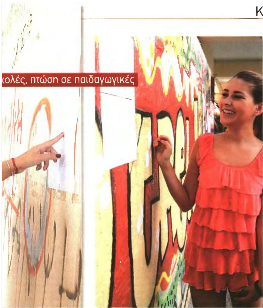
Σχολές, πτώση σε παιδαγωγικές