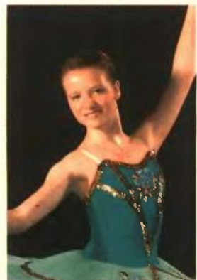
[Η «πρώτη των πρώτων»]

Αντίθετα, ανοδικά κινήθηκαν τα τμήματα γεωτεχνολογικού τομέα τόσο των πανεπιστημίων όσο και των