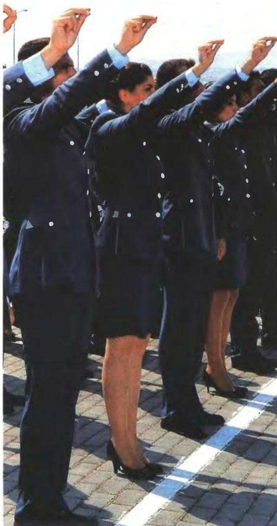
▲ ΟΙ ΥΠΟΨΗΦΙΟΙ θα πρέπει να μην έχουν καταδικασθεί για τέλεση ή απόπειρα κακούργηματος ή των εγκλημάτων ανυποταξίας, λιποταξίας, προσβολών του πολιτεύματος, προδοσίας της χώρας κ.λπ.