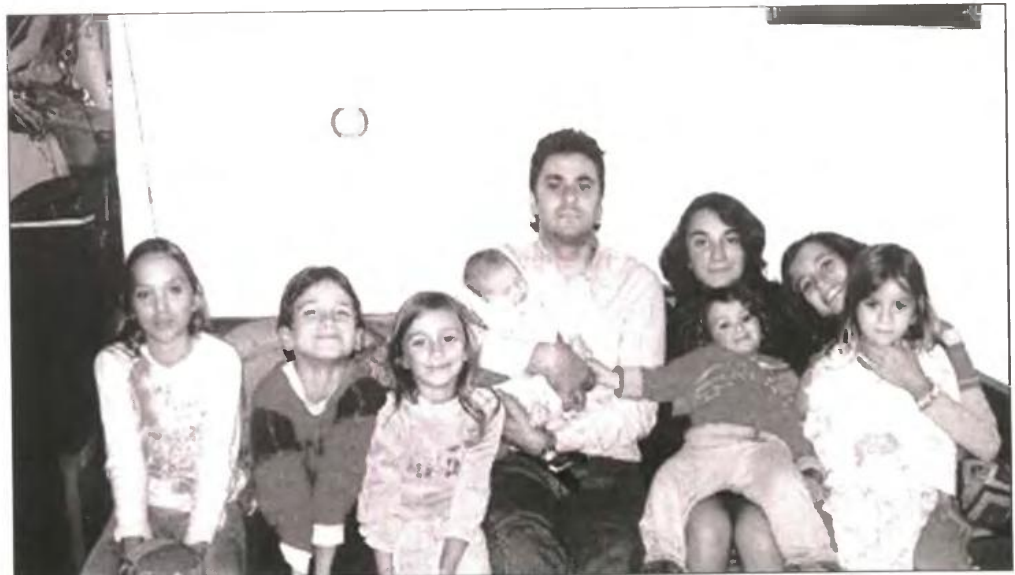
Στο στόχαστρο των πολυτέκνων βρίσκεται ο υφυπουργός Εργασίας Ν. Παναγιωτόπουλος

Σ το ποδι οι πολύτεκνοι του Νομού Μαγνησίας για τις νέες περικοπές που κυφορούνται στα πολυτεχνικά επιδόματα. Δημόσιο κάλεσμα της Ένωσης Πολυτεκνών Μαγνησίας που αριθμεί πάνω από 2.000 μέλη για τη μαζική συλλογική υπογραφή σε ανοιχτή επιστολή διαμαρτυρίας, με αποδέκτη τον πρωθυπουργό Αντώνη Σαμαρά.