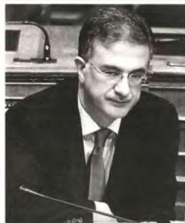
◀▲Ο Γ. ΜΑΥΡΑΓΑΝΗΣ θέλει να εφαρμόσει έναν εξαιρετικά απλό φορολογικό νόμο που προσομοιάζει με το αμερικανικό μοντέλο

Στη Βουλή μέσα στο πρώτο δεκαήμερο του Οκτωβρίου