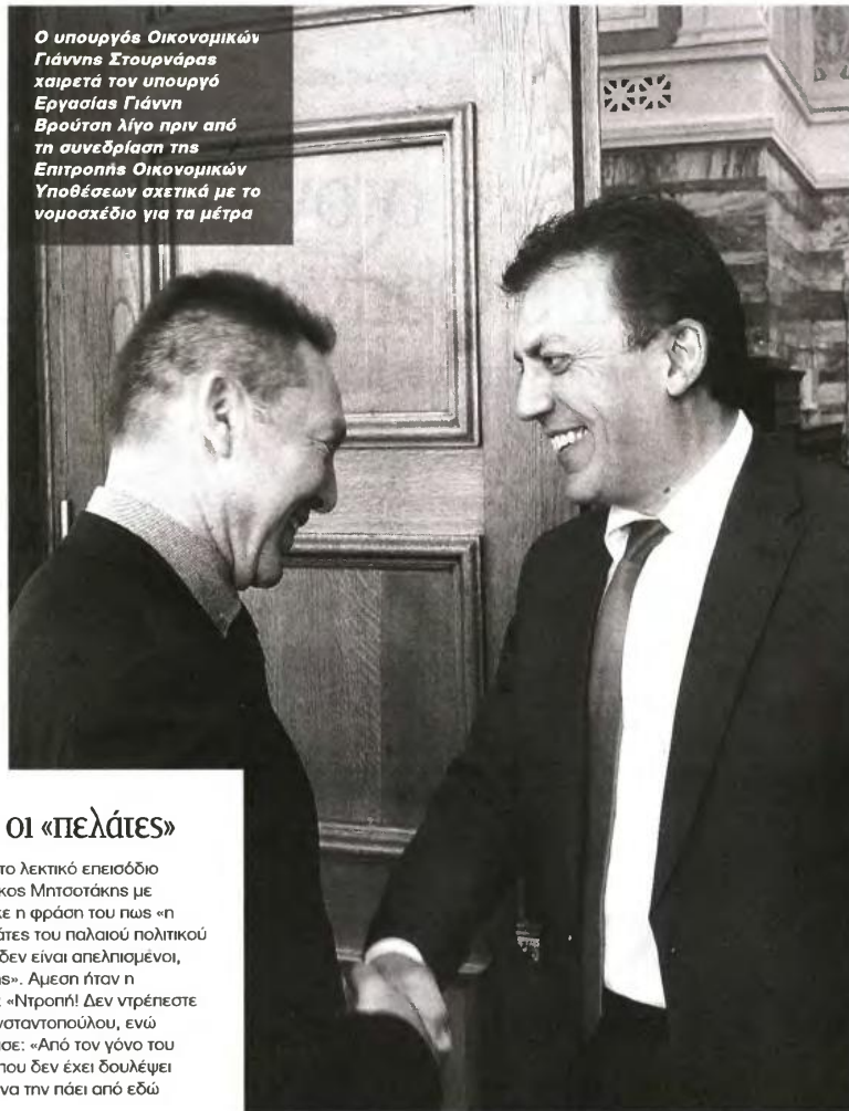
Ο υπουργός Οικονομικών Γιάννης Στουρνάρας χαιρετά τον υπουργό Εργασίας Γιάννη Βρούτσο λίγο πριν από τη συνεδρίαση της Επιτροπής Οικονομικών Υποθέσεων σχετικά με το νομοσχέδιο για τα μέτρα

Την ένταση πυροδότησε η απόφαση της κυβέρνησης να φέρει στη Βουλή το πολυνομοσχέδιο με τη διαδικασία του κατεπείγοντος, κάτι που προκάλεσε τις έντονες αντιδράσεις σύσσωμης της αντιπολίτευσης. «Το παρόν νομοσχέδιο έρχεται με τη δι-