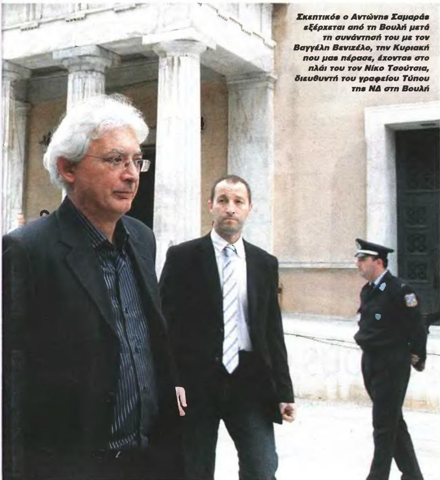
Σκεπτικός ο Αντώνης Σαμαράς εξέρχεται από τη Βουλή μετά τη συνάντησή του με τον Βαγγέλη Βενιζέλο, την Κυριακή που μας πέρασε, έχοντας στο πλάι του τον Νίκο Τσούσια, διευθυντή του γραφείου Τύπου της ΝΔ στη Βουλή

Με το ένα πόδι εκτός κυβέρνησης θεωρείται ότι βρίσκεται ο κ. Ρουπακιάς (αριστερά) μετά την – προς στιγμήν – άρνησή του να υπογράψει το πολυνομοσχέδιο. Ο κ. Σαμαράς φέρεται ότι αναζητάει προκθές τον αντικαταστάτη του μεταξύ του εγκληματολόγου Γιάννη Πανούση και των νυν αναπληρωτών υπουργών Κ. Τζαβέρα και Χ. Αθανασίου.