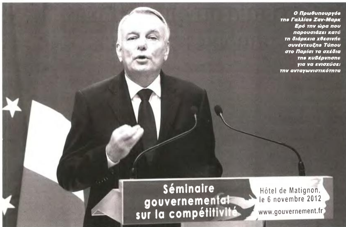
Ο Πρωθυπουργός της Γαλλίας Ζαν-Μαρκ Ερό την ώρα που παρουσιάζει κατά τη διάρκεια χθεσινής συνέντευξης Τύπου στο Παρίσι τα σχέδια της κυβέρνησης για να ενισχύσει την ανταγωνιστικότητα