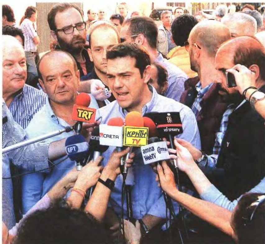
Ο Αλέξης Τσίπρας κάνει δηλώσεις στους δημοσιογράφους στο Πεδίον του Αρεως κατά τη χθεσινή συγκέντρωση διαμαρτυρίας της ΓΣΕΕ - ΑΔΕΔΥ κατά των νέων μέτρων

ΚΡΙΤΙΚΗ. Την ίδια ώρα ο ΣΥΡΙΖΑ ασκεί κριτική τόσο στη ΔΗΜΑΡ όσο και στο ΠΑΣΟΚ για τη στάση τους σήμερα στην ψηφοφορία. Μάλιστα όπως είπε χθες ο εκπρόσωπος Τύπου Πάνος Σκουρλέτης για τη ΔΗΜΑΡ, «είναι οχιζοφρενικό από τη μία να ψηφίζουν τον προϋπολογισμό που υλοποιεί τα 9,5 δισ. από αυτά τα μέτρα τη χρονιά που έρχεται και ταυτόχρονα να λένε για τα εργασιακά τα οποία σε έναν πολύ μεγάλο βαθμό έχουν δρομολογηθεί από τον Φεβρουάριο του 2012 ότι θα πουν "παρών"». Κριτική κατά της ΔΗΜΑΡ άσκησε και ο κοινοβουλευτικός εκπρόσωπος του ΣΥΡΙΖΑ Δημήτρης Παπαδημιούλης ο οποίος χαρακτήρισε «πολιτικαντισμό και υποκρισία» τη στάση των βουλευτών της Δημοκρατικής Αριστεράς.