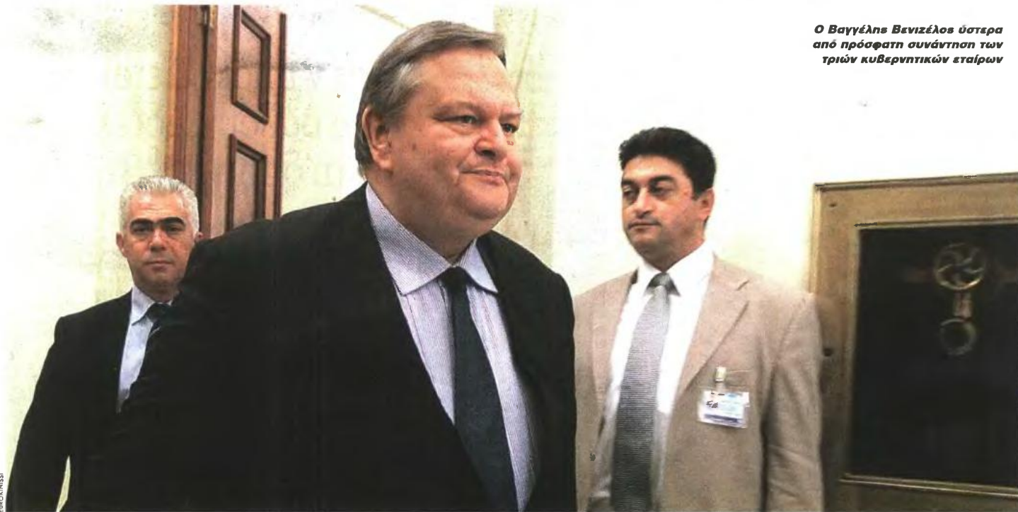
Ο Βαγγέλης Βενιζέλος ύστερα από πρόσφατη συνάντηση των τριών κυβερνητικών εταίρων