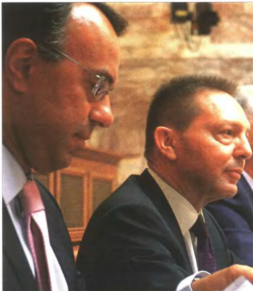
▲ Ο υπουργός Οικονομικών Γιάννης Στουρνάρας με τον αναπληρωτή υπουργό Χρήστο Σταϊκούρα