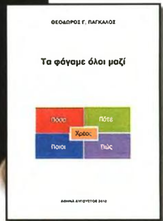
Το ηλεκτρονικό εξώφυλλο του «Τα φάγαμε όλοι μαζί» διά χειρός Πάγκαλου