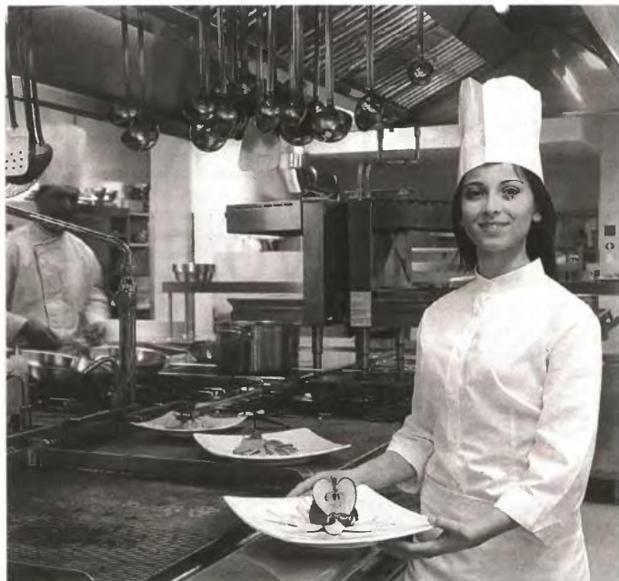
Στα ΙΕΚ θα εισαχθούν 225 σπουδαστές στην Ειδικότητα Τεχνικών Μαγειρικής Τέχνης

Στην ειδικότητα Ξενοδοχειακών και Επισιτιστικών Υπηρεσιών λειτουργούν οι εξής εκπαιδευτικές μονάδες: Αναβύσσου (Αττικής), Μακεδονίας, Ηρακλείου, Ρόδου, Κέρκυρας, Γαλαξιδίου, Θράκης και Ναυπλίου.