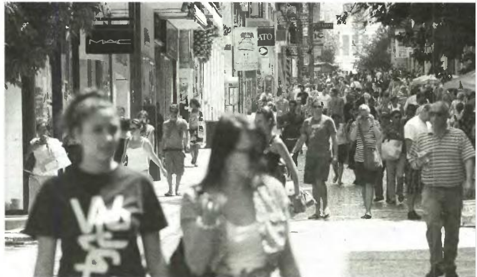
Η μείωση του ΦΠΑ σε όλα τα επίπεδα επιβάλλεται να μειωθεί άμεσα και, όσο αυτό καθυστερεί, τόσο θα υποβληθεί την όξυνση της κρίσης, όχι μόνο ως προς τα έσοδα του κράτους, αλλά και ως προς την κοινωνία

Αντίθετα, η αύξηση των άμεσων φόρων, ιδιαίτερα στην παραγωγική και εμπορική δραστηριότητα, λειτουργεί αναπτυξιακά, αφού σε πολλές των περιπτώσεων η διάθεση για αποφυγή φορολογίας ωθεί τις επιχειρήσεις σε επενδύσεις. Αυτό, βέβαια, για μια χώρα που επιλέγει να στηρίξει την οικονομία της στον δικό της συσσωρευμένο κοινωνικό πλούτο και δεν εκλιπαρεί το παγκόσμιο διεθνές κεφάλαιο, το οποίο ιστορικά πάντα λειτουργεί ληστικά, όπου και αν επένδυσε. Φυσικά, για την υγιή εκμετάλλευση του κοινωνικού πλούτου της χώρας απαιτεί-