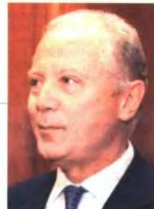
Ο διοικητής της Τράπεζας της Ελλάδος, Γιώργος Προβόπουλος.