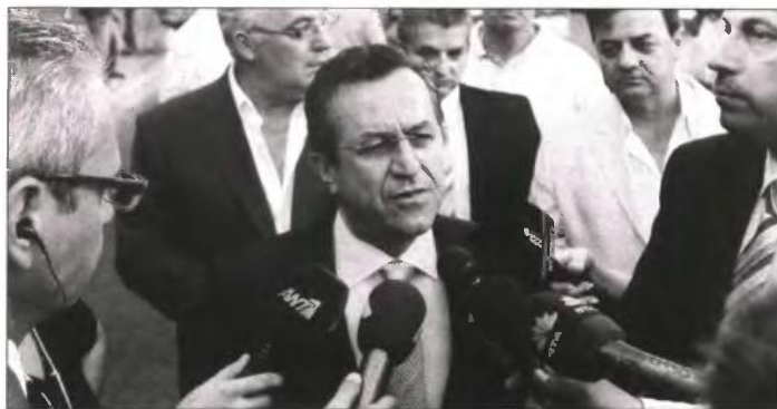
"Όσοι αφήνουν να διαρρεύσει πως παραιτήθηκα επειδή δεν είχα αρμοδιότητες ας μπουνο στο διαδικτυο να δουν πόσες είχα", υποστήριξε χθες ο κ. Νικολόπουλος

Στο θέμα της παραίτησης του κ. Νικολόπουλου αναφέρθηκε και ο εκπρόσωπος Τύπου της Δημοκρατικής Αριστέρας, Ανδρέας Παπαδόπουλος, ο οποίος τόνισε: "Είναι δεδομένο ότι ο κ. Νικολόπουλος θα ήθελε να ήταν αυτός υφυπουργός και όχι ο κ. Βρούτσης. Θα πρέπει πάντα στις επιλογές μας και πολύ περισσότερο σε αυτές τις πολύ κρίσιμες φάσεις, να είμαστε πολύ προσεκτικοί στο ποιους επιλέγουμε για τη στελέχωση της κυβέρνησης."