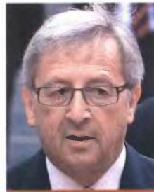
Γιάννης Στουρνάρας, υπουργός Οικονομικών

«Δεν έχει λόγο η Ελλάδα να ανησυχεί για την εξυπηρέτηση των υποχρεώσεων της τον Αύγουστο»