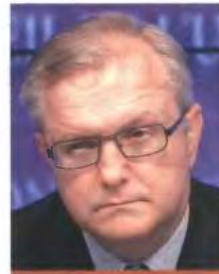
Ζαν-Κλοντ Γιούνκερ, πρόεδρος του Eurogroup.

«Η τρόικα, η οποία θα φθάσει στην Αθήνα στις 24 Ιουλίου, θα κάνει πλήρη καταγραφή των αναγκών.»