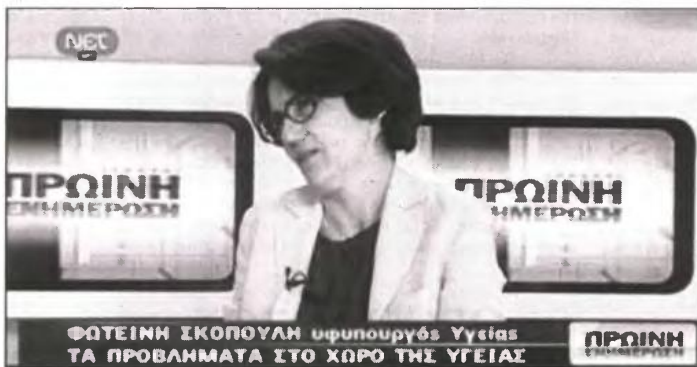
Έναν άκρωσ πρωτότυπο λόγο για την παρουσία της σε πρωινή εκπομπή έδωσε η νέα υφυπουργός Υγείας Φωτεινή Σκοπούλη, λέγοντας για την ακρίβεια: "Ηρθα στην εκπομπή γιατί δεν έχω τι να κάνω στο υπουργείο". Έχω ενημερωθεί αλλά δεν έχω ακόμη αρμοδιότητες" προσέθεσε

"Όσοι συμμετέχουν σ' αυτή την κυβέρνηση γνώριζαν ότι αναλαμβάνουν μια πολύ δύσκολη αποστολή. Είναι μια μεγάλη εθνική ανάγκη, μια πολύ κρίσιμη φάση και όσοι μπήκαν σε αυτή την κυβέρνηση γνώριζαν ότι δεν θα είναι εύκολα τα πράγματα. Δεν είναι υπουργγίλια του παλιού καλού καιρού. Προφανώς, όπως είπα ξανά, δεν είναι όλοι για τα δύσκολα", είπε χθες ο κ. Κεδίκογλου