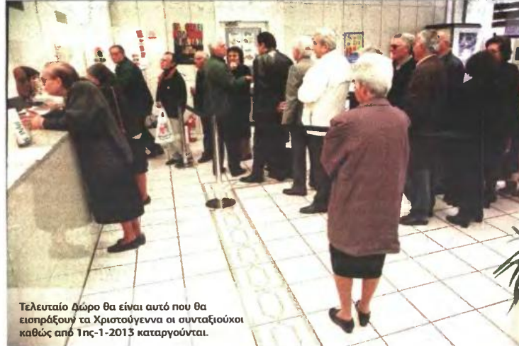
Τελευταίο Δώρο θα είναι αυτό που θα εισπράξουν τα Χριστούγεννα οι συνταξιούχοι καθώς από 1ης-1-2013 καταργούνται.

(ατομικό) ή τα 8.640 ευρώ (οικογενειακό) το χρόνο.