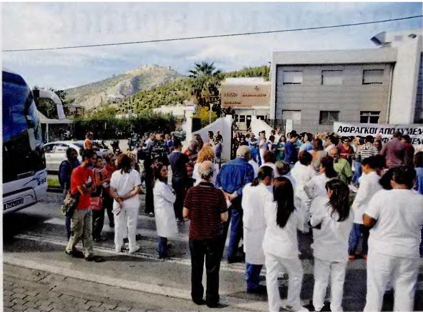
Συνκέντρωση διαμαρτυρίας εργαζομένων και άλλων φορέων στο νοσοκομείο του Αργούς.

• Από 1/1/2014 ορίζεται η εκ μέρους των ασθενών καταβολή υπέρ ΕΟΠΥΥ του ποσού του ενός ευρώ ανά συνταγή που εκτελείται από τον φαρμακοποιό, καθώς και η καταβολή 25 ευρώ για εισαγωγή και νοσπλεια σε νοσοκομείο του ΕΣΥ. Πηγές του υπουργείου Υγείας ανέφεραν ότι τα συγκεκριμένα μέτρα θα εφαρμοστούν μόνο στην περίπτωση που δεν επιτευχθούν οι οικονομικοί στόχοι στην Υγεία, που είναι για το διάστημα 2013-