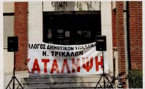
Σταγμότυπο από την είσοδο του δημαρχείου Τρικάλων, σε πρόσφατη κατάληψη, για τη μείωση της χρηματοδότησης των δήμων.

• Ρυθμίζεται η επιμήκυνση της αποπληρωμής των δανειακών υ-