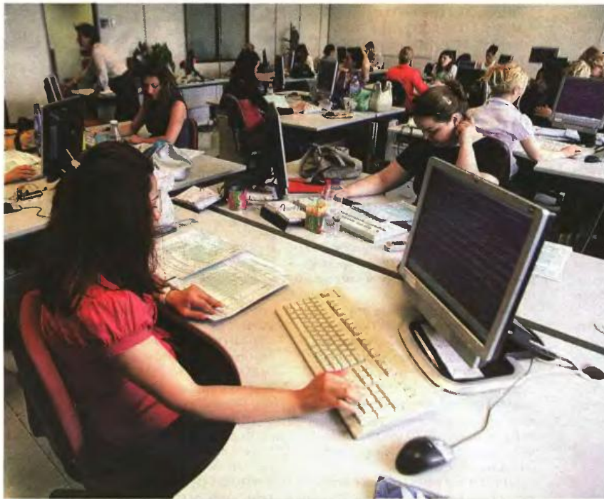
Εκτός των απολύσεων χιλιάδων μόνιμων υπαλλήλων θα υπάρξει ριζική μείωση σε συμβασιούχους ορισμένου χρόνου και έργου, καθώς και σε ωρομίσθιους ή ημερομίσθιους.

σθιοι σε 711, με τον αριθμό τους να περιορίζεται δραστικά, ώστε να υπάρξει μείωση προσωπικού και εξοικονόμηση δαπανών.