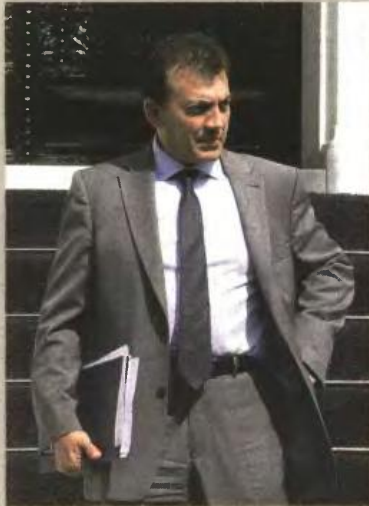
Σε μια πρόταση συμβιβασμού για τις αποζημιώσεις κατέληξαν χθες ο υπουργός Εργασίας Γιάννης Βρούτσης και η Τρόικα, ύστερα από επίπονες διαπραγματεύσεις.