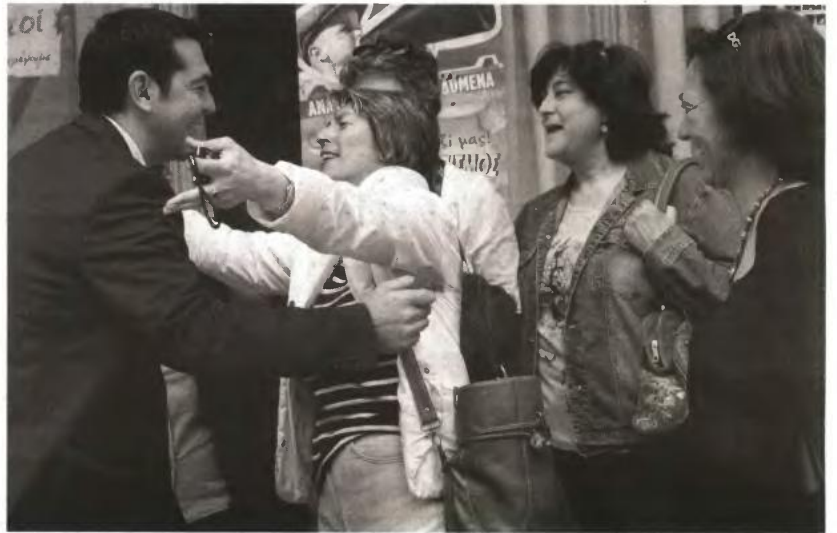
Ο ΣΥΡΙΖΑ ΕΚΜ θα κάνει ό,τι περνά από το χέρι του για να υπερασπιστεί τους πολλούς που πλήττονται

Κι όλα αυτά παρ' ό,τι η Βουλή επισήμως από την Παρασκευή πάει... διακοπές. Το ίδιο δεν θα ισχύσει για τον ΣΥΡΙΖΑ ΕΚΜ, που δεν σκοπεύει να... κλείσει το μαγαζί, αλλά να εκμεταλλευτεί την περίοδο, όχι μόνο για τις απαραίτητες ανάσες, αλλά και για την περαιτέρω προετοιμασία του ενόψει των μεγάλων μετώπων που ανοίγονται. Οι απαιτήσεις είναι τεράστιες και δεν υπάρχει πολυτέλεια χρόνου, λένε από το εσωτερικό του σκάμματος, δίνοντας το παράδειγμα του «νομοθετικού» όγκου δουλειάς που έχει ήδη βγάλει ως αξιωματική αντιπολίτευση. Διότι το «τρίαιμα εναντίον ενός» που λέγαμε πριν, ισχύει, αντισημασμένο, και για τις προτάσεις νόμου: Ήδη η αξιωματική αντιπολίτευση έχει καταθέσει τρεις, για τα εργασιακά, την τριτοβάθμια εκπαίδευση και τα υπερχρεωμένα νοικοκυριά έναντι μόλις... μισού νόμου