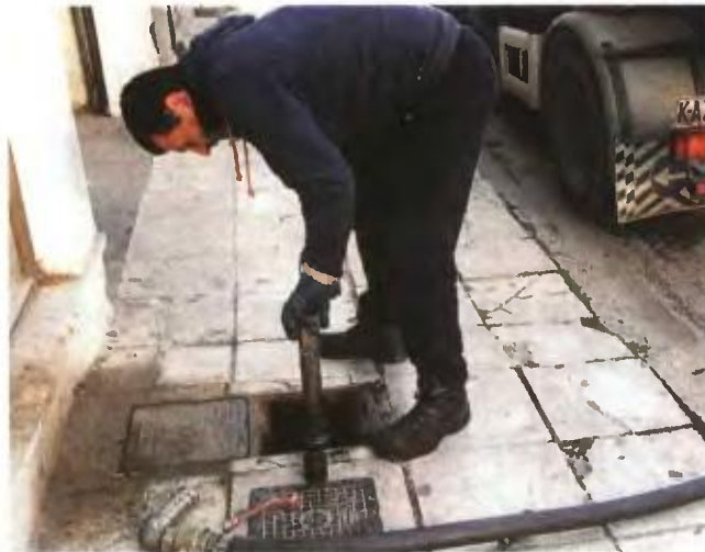
▲ ΕΚΤΟΣ ΤΩΝ ΑΛΛΩΝ θα προβλέπονται και κοινωνικά κριτήρια για το επίδομα θέρμανσης

Οι δικαιούχοι και το ύψος του επιδόματος σύμφωνα με την πρόταση που επεξεργάζονται στο υπουργείο Οικονομικών