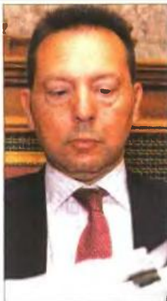
▲ Ο υπουργός Οικονομικών Γιάννης Στουρνάρας