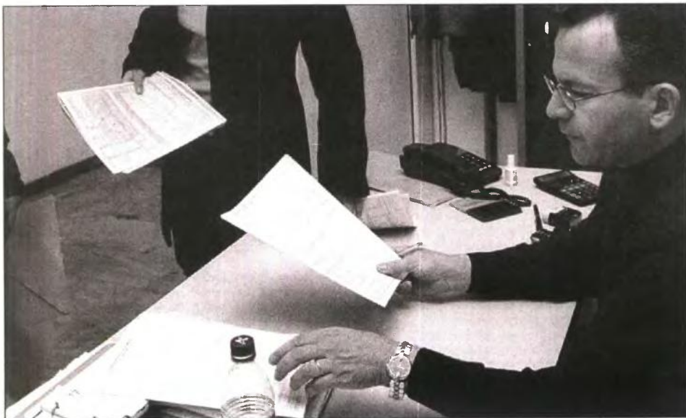
Κεντρικός άξονας των αλλαγών θα είναι η κατάργηση δεκάδων φοροαπαλλαγών για τα μεσαία και υψηλά εισοδήματα και αλλαγές στη φορολογική κλίμακα

Σε ό,τι αφορά τις φοροαπαλλαγές, τα σενάρια που επεξεργάζονται οι επιτελείς του υπουργείου Οικονομικών προβλέπουν: