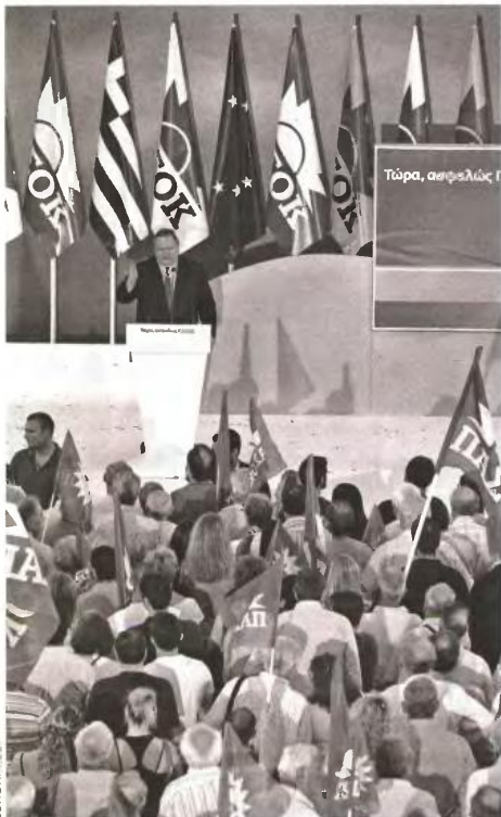
«Δεν θα θιγούν ο 13ος και ο 14ος μισθός» διατυπώνει ο Ε. Βενιζέλος στην προεκλογική συγκέντρωση της 4ης Μαΐου στο Σύνταγμα