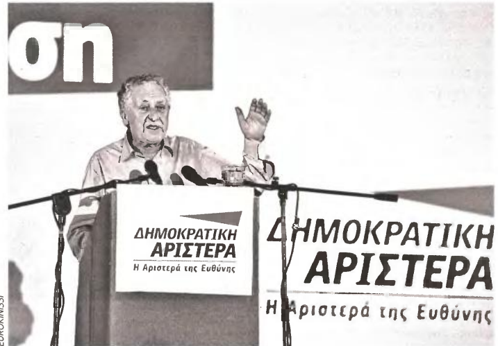
Ο Ο. Κουβεβίτης είχε προτείνει διαφορετική πολιτική για αποδέσμευση από το Μνημόνιο και δημοσιονομική προσαρμογή. Τελικά «προσαρμόστηκε» ο ίδιος