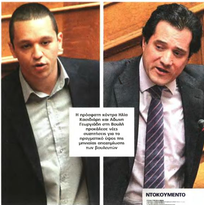
Η πρόσφατη κόντρα Ηλία Κασιδιάρη και Αδωνη Γεωργιάδη στη Βουλή προκάλεσε νέες συζητήσεις για το πραγματικό ύψος της μηνιαίας αποζημίωσης των βουλευτών

Πέραν αυτών, στα 6.200 ευρώ πρέπει να προστεθεί και η αποζημίωση που λαμβάνει κάθε βουλευτής για τη συμμετοχή του στις κοινοβουλευτικές επιτροπές και μεσοσταθμικά κυμαίνεται από 800 έως 1.000 μηνιαίως. Υπό αυτά τα δεδομένα, με τη μορφή μετρητών ο κάθε βουλευτής παίρνει τουλάχιστον 7.000 ευρώ καθαρά. Αν αποζημιωθούν και μια σειρά παροχών σε είδος, όπως βουλευτικό αυτοκίνητο, συνεργάτες που πληρώνονται