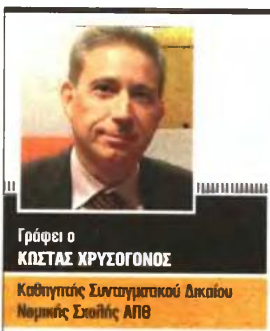
Γράφει ο ΚΩΣΤΑΣ ΧΡΥΣΟΓΟΝΟΣ Καθηγητής Συνταγματικού Δικαίου Νομικής Σχολής ΑΠΘ

ΑΚΟΜΗ ΒΑΡΥΤΕΡΕΣ από τις διαδικαστικές είναι όμως οι ουσιαστικές αντισυνταγματικές που σηματοδοτούν το νομοσχέδιο αυτό. Ενδεικτικά επι-