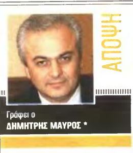
Γράφει ο ΔΗΜΗΤΡΗΣ ΜΑΥΡΟΣ

Τώρα όλοι ρίχνουν το γάντι στο Μαξίμο και προειδοποιούν ότι «αν δεν καταφέρουμε να ρίξουμε τις τιμές και να πάσουμε τη φοροδιαφυγή, έχουμε τελειώσει», ενώ οι πλέον απαισιόδοξοι βλέπουν εσωτερική κατάρρευση εάν καθυστερήσει να εισέλθει στην οικονομία ζεστό χρήμα.