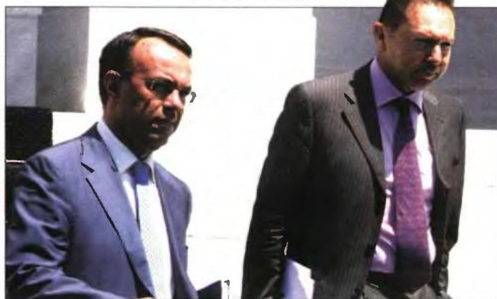
▲ Ο υπουργός Οικονομικών Γ. Στουρνάρας με τον αναπληρωτή υπουργό Χρ. Σταϊκούρα