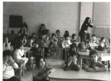
● Τις έντονες αντιδράσεις πολυτέκνων, τρίτεκνων και άλλων χαμηλόμισθων προκαλούν τα αιτήματα βρεφονηπιακών και παιδικών σταθμών να πληρώσουν οι γονείς περισσότερα χρήματα για τροφεία

Ο κ. Βαλάκας από την πλευρά του πάντως σημείωσε πως οι ενστάσεις ήταν πολλές, η διαδικασία ελέγχου ολοκληρώθηκε και τώρα βρισκόμαστε στη διαδικασία παραπήσεων και αντικατάστασης των παιδιών που δεν είχαν τα ανάλογα δικαιολογητικά και δεν πληρούσαν προϋποθέσεις. Σημειώνεται ότι περίπου είχαν υποβληθεί από τη Μαγνησία 1464 αιτήσεις για 1800 παιδιά, ενώ φέτος οι αιτήσεις αυξήθηκαν σε 1831 για 2426 παιδιά (34,8%).