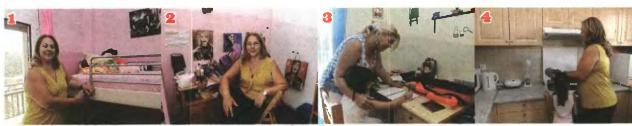
1234: Οι Μπέρες SOS μαγειρεύουν, συζητούν, βοηθούν στα μαθήματα, μαθαίνουν τα παιδιά να συμβιώνουν στο ίδιο σπίτι και τους προσφέρουν αμέτρητα φιλιά.

«ΟΙ ΓΥΝΑΙΚΕΣ ΕΧΟΥΝ ΣΥΝΕΧΗ ΠΑΡΟΥΣΙΑ ΣΤΟ ΧΩΡΙΟ ΜΕ ΟΚΤΩ ΡΕΠΟ ΤΟΝ ΜΗΝΑ, ΜΙΣΘΟ 1.000-1.200 ΕΥΡΩ ΚΑΙ ΑΝΑΛΑΜΒΑΝΟΥΝ ΤΗΝ ΑΝΑΤΡΟΦΗ ΠΕΝΤΕ ΕΩΣ ΕΞΙ ΠΑΙΔΙΩΝ»