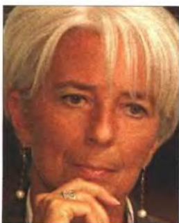
▲ Η Κριστίν Λαγκάρντ