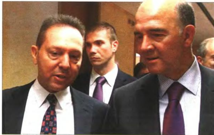
▲ Ο υπουργός Οικονομικών Γιάννης Στουρνάρας συνομιλεί με τον υπουργό Οικονομίας και Οικονομικών της Γαλλίας Πιερ Μοσκοβισί στη συνάντηση που είχαν στην Αθήνα

Η τριόγκα διατηρεί στην κορυφή της ατζέντας τη μείωση του