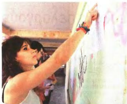
▲ ΣΤΑ ΠΑΙΔΑΓΩΓΙΚΑ ΤΜΗΜΑΤΑ, η άνοδος αναμένεται μεγαλύτερη για τα πανεπιστήμια Αθήνας και Θεσσαλονίκης

ΤΑ 19.000 μόρια αναμένεται να «αγγίξει» η βάση στη Νομική Αθήνας εξαιτίας της αύξησης των αριστοκτών μεταξύ των υποψηφίων της θεωρητικής κατεύθυνσης, ενώ η αντίστοιχη σχολή του Αριστοτελείου θα «σκαρφώσει» κοντά στα 18.750 μόρια. Ευκολότερο έργο θα έχουν οι υποψήφιοι που θέλουν να σπουδάσουν στη Νομική του Δημοκρίτειου (Κομοτηνή), αφού η βάση θα διαμορφωθεί κοντά στα 18.000 μόρια.