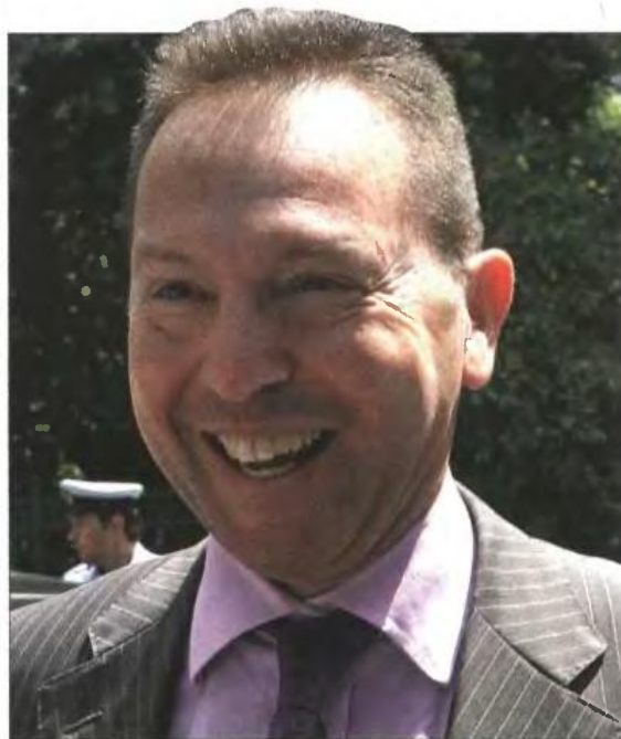
▲ Ο υπουργός Οικονομικών Γ. Στουρνάρας χθες έξω από το Μέγαρο Μαξίμου

βληθεί κεντρικά από το Γενικό Λογιστήριο του Κράτους. Το προσεχές των προτάσεων από τα εμπλεκόμενα υπουργεία θα παρουσιαστεί στη σημερινή συνάντηση του πρωθυπουργού Αντ. Σαμαρά με τον πρόεδρο του ΠΑΣΟΚ Ευ. Βενιζέλο και τον πρόεδρο της Δημοκρατικής Αριστέρας Φ. Κουβέλη. Σύμφωνα με στελέχη του υπουργείου Οικονομικών, στο σχέδιο δεν θα προβλέπει περικοπές δαπανών κωδικό προς κωδικό, αλλά μια γενική περιγραφή κατευθύνσεων για την εξοικονόμηση των 11,6 δις. ευρώ. Οι διαβουλεύσεις αναμένεται να συνεχιστούν και μετά τη σύσκεψη των πολιτικών αρχηγών, ώστε να συνταχτεί ένας «οδικός χάρτης» παρεμβάσεων, που θα παρουσιαστεί στην τριόικα στις 26 Ιουλίου. Πάντως, το κλίμα στο υπουργείο Οικονομικών είναι βαρύ, καθώς εντείνονται οι αποκλίσεις από τους στόχους του Προϋπολογισμού, την ώρα που οι κυβερνητικές εκτιμήσεις κάνουν λόγο για ύφεση που θα φτάσει φέτος στο 7%. Υψηλόβαθμο στέλεχος του υπουργείου δήλωνε ότι «υπάρχουν φωνές στο Eurogroup που πιέζουν για τη λήψη πρόσθετων μέτρων φέτος» και ότι η κυβέρνηση δεν μπορεί να επικαλεστεί τη βαθύτερη ύφεση σε σχέση με τις προβλέψεις του Μνημονίου, σε μια προσπάθεια να τα αποφύγει.