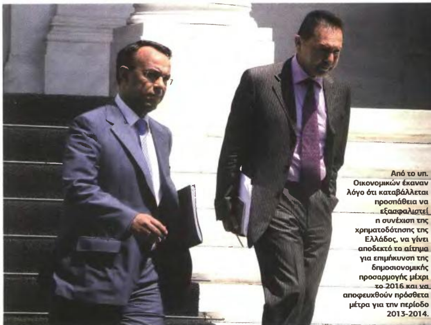
Από το υπ. Οικονομικών έκαναν λόγο ότι καταβάλλεται προσπάθεια να εξασφαλιστεί η συνέχιση της χρηματοδότησης της Ελλάδας, να γίνει αποδεκτό το αίτημα για επιμήκυνση της δημοσιονομικής προσαρμογής μέχρι το 2016 και να αποφευχθούν πρόσθετα μέτρα για την περίοδο 2013-2014.

Α νοικτό το ενδεχόμενο να ληφθούν πρόσθετα δημοσιονομικά μέτρα την περίοδο 2012-2014 και μάλιστα να αποφρασιστούν ακόμη και οριζόντιες περικοπές σε συντάξεις, εφάπαξ, παροχές και κοινωνικά επιδόματα αφήναν χθες ανώτατες κυβερνητικές πηγές, επιδιώκοντας να προβλέψουν τις εξελίξεις που θα σημειωθούν μετά τις διαπιστώσεις ότι φέτος η ύφεση της ελληνικής οικονομίας θα είναι πολύ βαθύτερη από αυτήν που είχε προβλεφθεί στο Μνημόνιο και ότι θα σημειωθεί υπέρβαση του στόχου του Προϋπολογισμού για το πρωτογενές έλλειμμα, που θα φθάσει τα 2 δισ. ευρώ. Η Τρόικα που θα επιστρέψει στην Αθήνα την επόμενη εβδομάδα αναμένεται να ασκήσει πιέσεις προς την κατεύθυνση της λήψης πρόσθετων μέτρων, ενώ δεν αποκλείεται να ζητήσει και οριζόντιες περικοπές συντάξεων και κοινωνικών παροχών, καθώς θα διαπιστώσει δυστοκία της ελληνικής πλευράς να βρει μέτρα περικοπών «διαρθρωτικού χαρακτήρα».