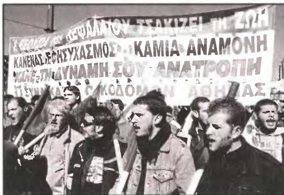
Κλάδοι, όπως αυτός των οικοδόμων, θα δεχτούν νέο συντριπτικό πλήγμα από τις νέες περικοπές της συγκυβέρνησης

Ηρθε η σειρά της κατάργησης των εναπομειναντων επιδομάτων και μαζί με αυτά και του εποχικού επιδόματος των οικοδόμων και των εργαζομέ-