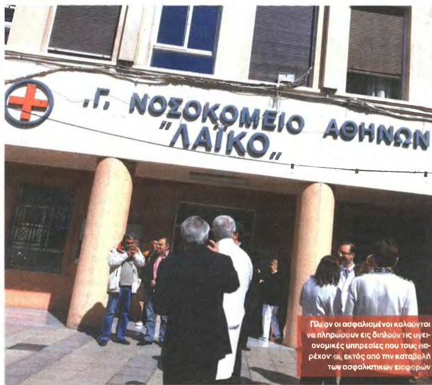
Πάνοι οι ασφαλισμένοι καλούνται να πληρώσουν εις διπλούν τις υγειονομικές υπηρεσίες που τους παρέχονται, εκτός από την καταβολή των ασφαλιστικών εισφορών

Στο κεφάλαιο του νομοσχεδίου, που θα τεθεί σε ψηφοφορία στη Βουλή σήμερα το βράδυ, με τίτλο «Ρυθμίσεις Θεμάτων Φαρμακευτικών Δαπανών, Συμψηφισμού Απαιτήσεων και Εκκαθαρισμένων Οφει-