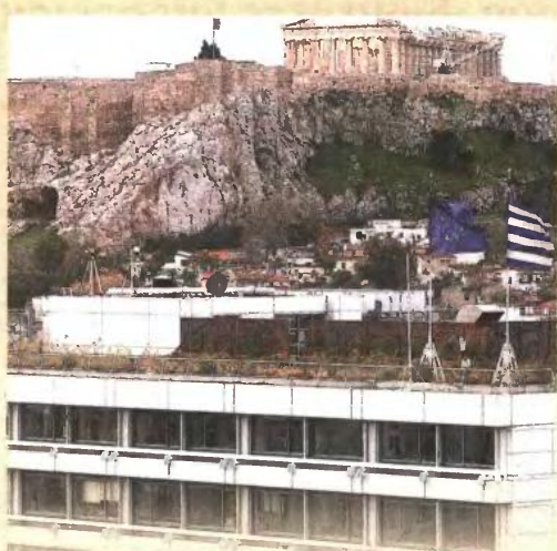
Από πού θα περικοπούν 2,5 δισ. ευρώ