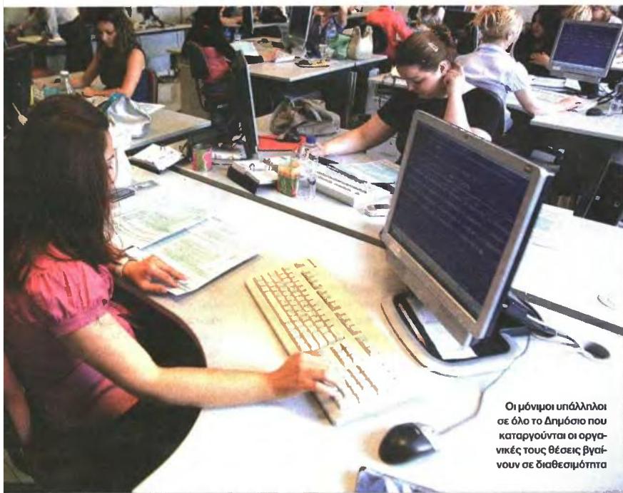
Οι μόνιμοι υπάλληλοι σε όλο το Δημόσιο που καταργούνται οι οργανικές τους θέσεις βγαίνουν σε διαθεσιμότητα

λος εντός και εκτός εργασίας θα βρίσκεται κάτω από το άγρυπνο μάτι του «μεγάλου αδελφού».