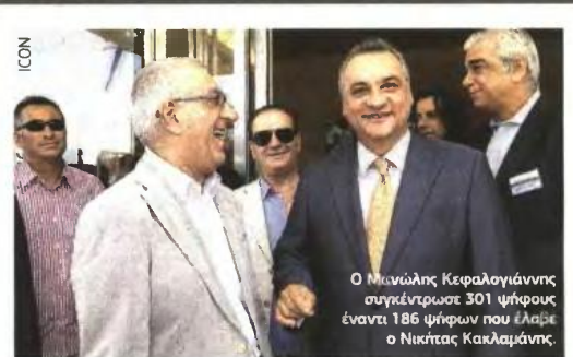
Ο Μανώλης Κεφαλογιάννης συγκέντρωσε 301 ψήφους έναντι 186 ψήφων που έλαβε ο Νικήτας Κακλαμάνης.

«Με την επιστροφή των οφειλών του Δημοσίου, την ένωση ρευστότητας και την εκταμίευση μέρους από τα κεφάλαια του ΕΣΠΑ που δεν έχουν ακόμα απορροφηθεί, η τόνωση της ελληνικής οικονομίας την επόμενη χρονιά θα είναι μεγαλύτερη από τις νέες θυσίες», δήλωσε ο πρωθυπουργός θέλοντας να δείξει έτσι πως υπάρχει φως στο βάθος του τούνελ και αν γίνουν όλα όσα πρέπει σύντομα θα βγει η χώρα από την κρίση. ■