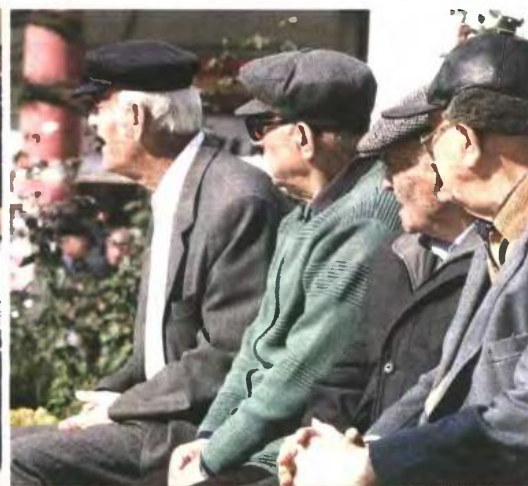
Δημόσιοι υπάλληλοι και συνταξιούχοι θα σπρώξουν το μεγαλύτερο βάρος από το πακέτο μέτρων των 11,5 δισ. ευρώ την επόμενη διετία.

Το πιο ισχυρό σοκ αναμένεται να το υποστούν 2,8 εκατ. συνταξιούχοι, 150.000 εν ενεργεία ασφαλισμένοι και 1 εκατ. δικαιούχοι επιδομάτων