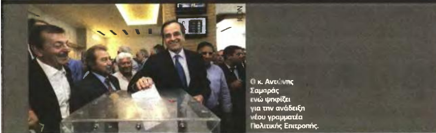
Ο κ. Αντώνης Σαμαράς ενώ ψιφίζει για την ανάδειξη νέου γραμματέα Πολιτικής Επιτροπής.