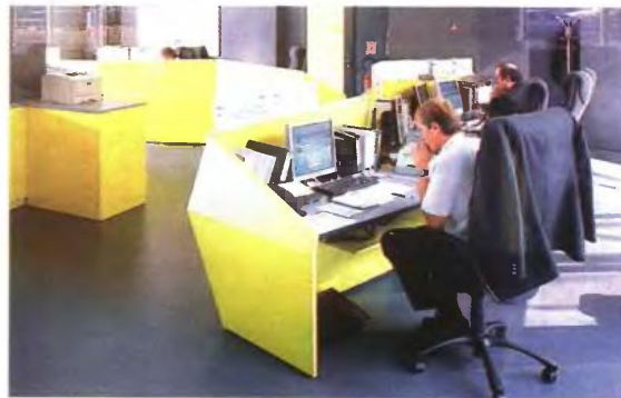
Τα προγράμματα του ΟΑΕΔ για ενίσχυση της απασχόλησης απευθύνονται στις ιδιωτικές επιχειρήσεις όλων των τομέων και μεγεθών, αλλά και σε επιχειρήσεις της τοπικής αυτοδιοίκησης.

Δικαιούχοι του προγράμματος είναι όλες οι ιδιωτικές επιχειρήσεις και γενικά οι εργοδότες του ιδιωτικού τομέα. Για να υπαχθεί μια επιχείρηση στο πρόγραμμα, δεν θα πρέπει να έχει προβεί, κατά τη διάρκεια του τριμήνου πριν από την