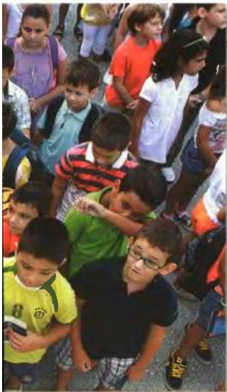
Παρασκευή 31 Αυγούστου 2012