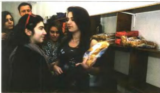
Ο Δήμος Αθηναίων έθεσε σε λειτουργία τον τηλεφωνικό αριθμό 15422, όπου οι πολίτες μπορούν να δηλώνουν την προσφορά τους σε σχολικά είδη, τα οποία οι γονείς