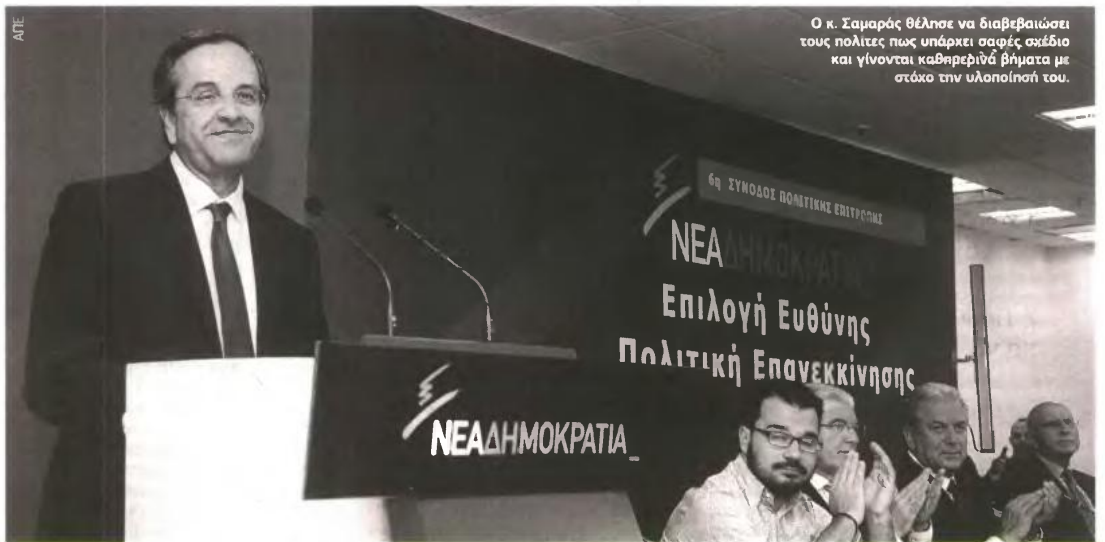
Ο κ. Σαμαράς θέλησε να διαβεβαιώσει τους πολίτες πως υπάρχει σαφές σχέδιο και γίνονται καθημερινά βήματα με στόχο την υλοποίησή του.

ΔΗΜΗΤΡΗΣ ΚΟΤΤΑΡΙΔΗΣ dkottaridis@e-typos.com