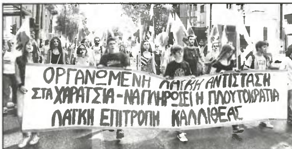
Οργανωμένη λαϊκή απερίθεση για να μη βρουν τόπο να σταθούν τα νέα μέτρα που κάνουν κόλαση τη ζωή του λαού

• Η πρώτη «αποτίμηση» του πρόσφατου αντεργατικού πακέτου (μείωση κατώτατου μισθού, μετενέργεια, πάγωμα μισθών και μισθολογικών ωρμηάνσεων, κατάργηση της μονιμότητας στις πρώην ΔΕΚΟ).