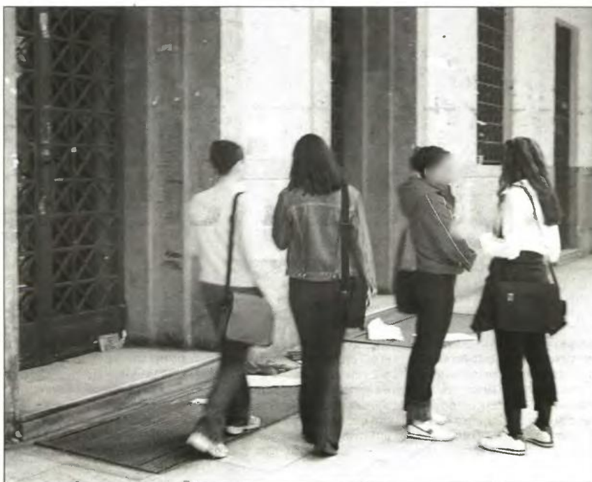
ή στα Γιάννενα μπορεί με τα κοινωνικά κριτήρια να εισαχθεί στην Ια-

Σε ένα άλλο παράδειγμα, ένας φοιτητής του οποίου ο άλλος αδερφός έχει εισαχθεί στη Θεσσαλονίκη