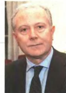
Γιώργος Προτόπουλος, Διοικητής της ΤτΕ

Το διοικητικό συμβούλιο του Δικηγορικού Συλλόγου Αθηνών (ΔΣΑ), σε χθεσινή έκτακτη συνεδρίασή του, εκφράζει τη ριζική αντίθεσή του στη φημιλογοούμενη κατάργηση του αφορολόγητου ορίου και των λοιπών μέτρων, ενώ προαναγγέλλει κινητοποιήσεις .