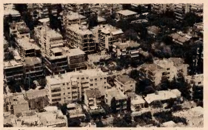
Εξετάζεται η κατάργηση της έκπτωσης των τόκων από τη χορήγηση στεγαστικού δανείου για πρώτη κατοικία.

– Κατάργηση των αφορολόγητων ορίων που ισχύουν για τις οικογένειες με παιδιά. Το κόστος