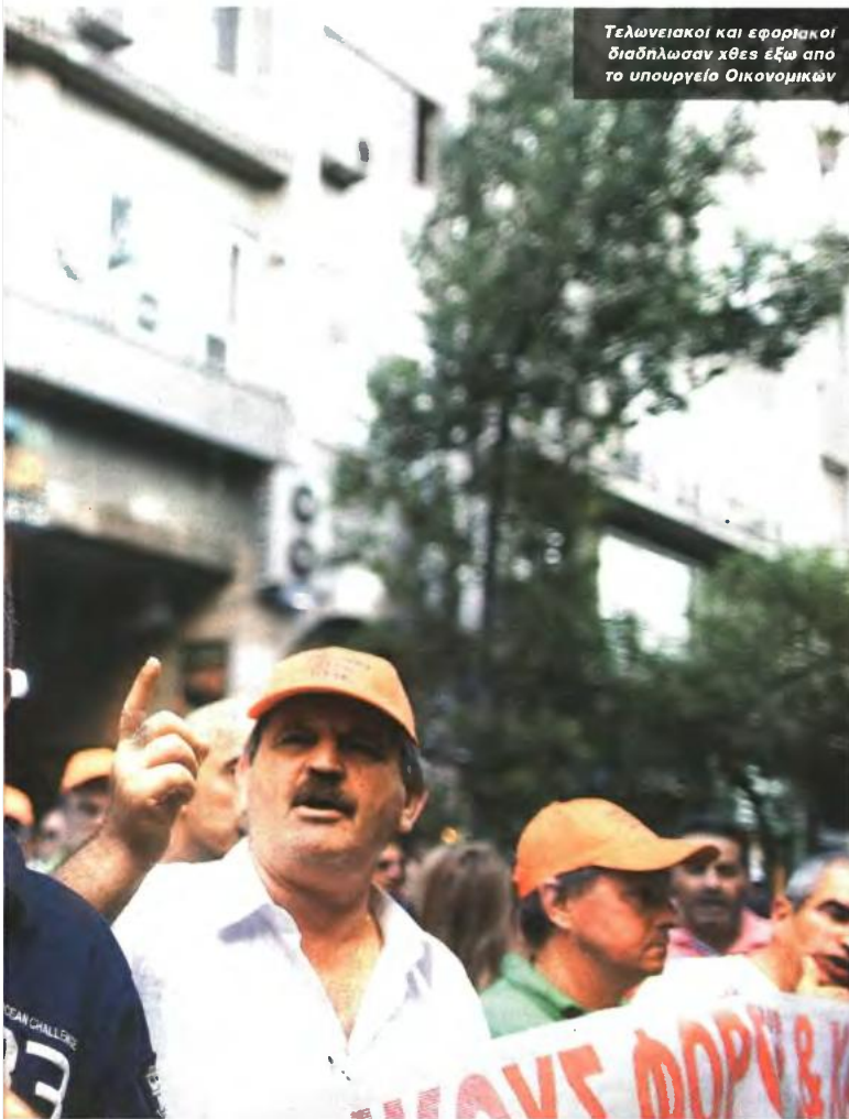
Τελωνειακοί και εφοριακοί διαδήλωσαν χθες έξω από το υπουργείο Οικονομικών