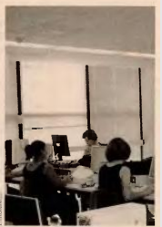
Η εξοικονόμηση από το κονδύλι για μισθούς υπολογίζεται στο 1,3 δισ. ευρώ.