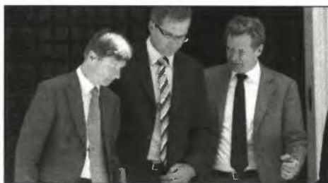
χρηματοδοτικού κενού, ύψους 15 δισ. ευρώ, που δημιουργεί η επιμήκυνση του προγράμματος δημοσιονομικής προσαρμογής.

Σύμφωνα με κυβερνητικές πηγές, το πακέτο των μέτρων θα κλείσει μόνο όταν υπάρξει η τελική συμφωνία με την τρόικα, με δεδομένη τη θέση των Ευρωπαίων εταίρων ότι αναμένουν την έκθεση των στελεχών της Ευρωπαϊκής Επιτροπής, της Ευρωπαϊκής Κεντρικής Τράπεζας και του Διεθνούς Νομισματικού Ταμείου. Στο υπουργείο Οικονομικών καταγράφεται ανησυχία για τη στάση της τρόικας, με δεδομένες τις τριβές που υπάρχουν ανάμεσα στην Ευρωπαϊκή Επιτροπή και το Διεθνές Νομισματικό Ταμείο αναφορικά με τη βιωσιμότητα του ελληνικού χρέους και την κάλυψη του