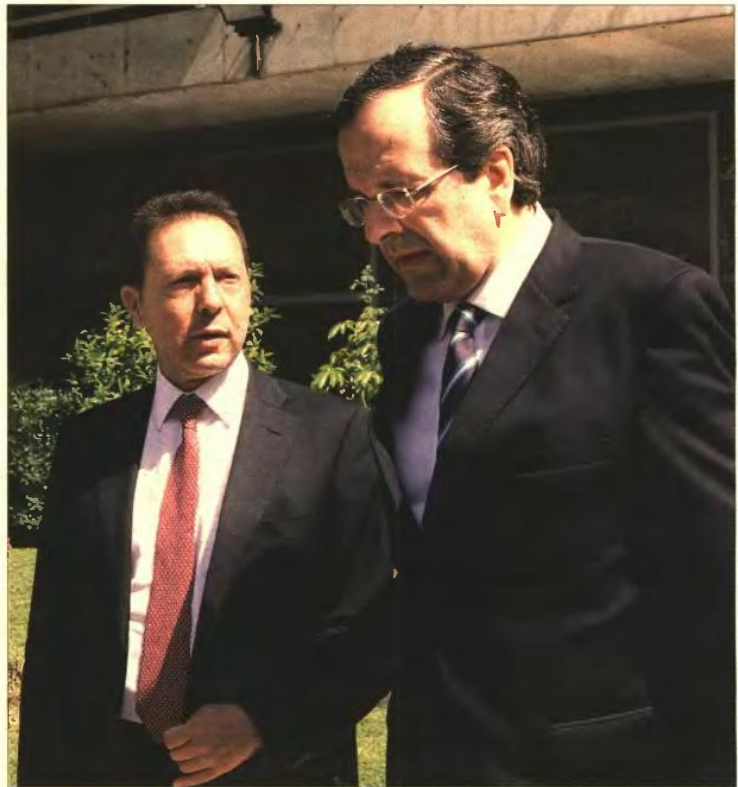
► Στο πρωθυπουργικό επιτελείο ευελπιστούν ότι οι Γερμανοί θα κάνουν ακόμη μία κίνηση για το θέμα του ελληνικού χρέους, ενδεχομένως με μείωση των επιτοκίων

Στο Μέγαρο Μαξίμου θέλουν σε κάθε περίπτωση να προχωρήσει η εκταμίευση της δόσης των 31,5 δισ. ευρώ πριν από το τέλος του Οκτωβρίου και σίγουρα πριν από τις αμερικανικές εκλογές της 8ης Νοεμβρίου. Ο πρωθυπουργός δεν υποτίμησε την πληροφορία του Reuters, σύμφωνα με την οποία η έκθεση της τριόρας και άρα η δόση θα δοθούν μετά τις εκλογές στην άλλη πλευρά του Ατλαντικού, και γι' αυτό έχει ήδη διευρυνθεί με τους ομολόγους του το ενδεχόμενο να συγκληθεί έκτακτο Eurogroup μια εβδομάδα