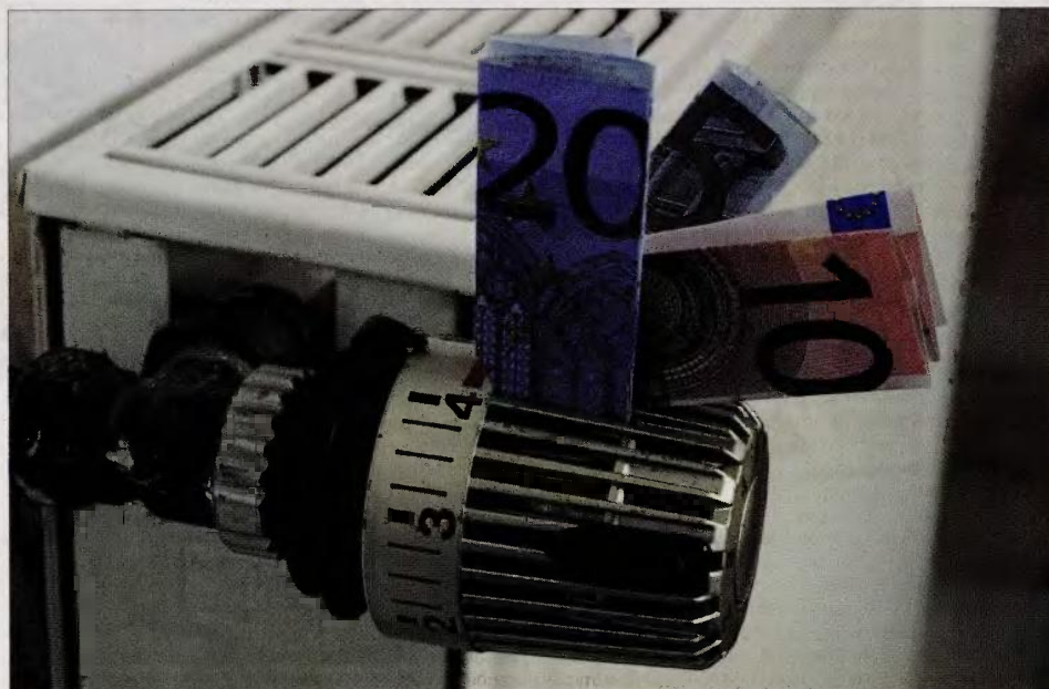
▲ Από τις 15 Οκτωβρίου οι Ειδικοί Φόροι Κατανάλωσης (ΕΦΚ) σε πετρέλαιο θέρμανσης και κίνησης εξισώνονται στο 80%

Στην περίπτωση που η τρόικα εγκρίνει το κονδύλι ενός τέτοιου προγράμματος επιδόματος της θέρμανσης μέσω του υπουργείου Οικονομικών, η κυβέρνηση εξετάζει το ενδεχόμενο να χορηγείται με τους λογαριασμούς της ΔΕΗ. Πιο αναλυτικά, το σχέδιο της κυβέρνησης για τη χορήγηση του επιδόματος προβλέπει: