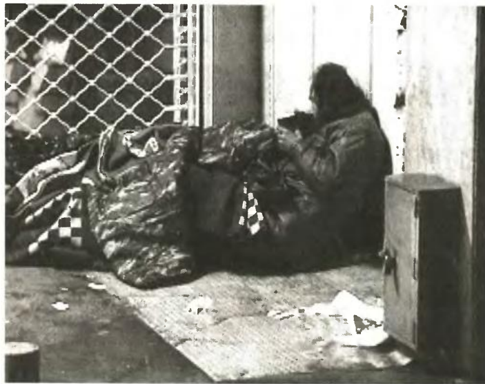
Φωνάζουν όσοι παίρνουν ακόμη παχουλούς μισθούς, τι να πουν και όσοι πεινάνε και γυρνάνε στους δρόμους και τα παιδιά τους λιποθυμούν στα σχολεία από την πείνα;

Το χρέος θα ξεχρεωθεί αμέσως αν όλοι οι πλούσιοι δώσουν τα χρήματα που βγάζουν σε τράπεζες του εξωτερικού. Αν εσείς δώσετε το παράδειγμα τότε όλοι οι