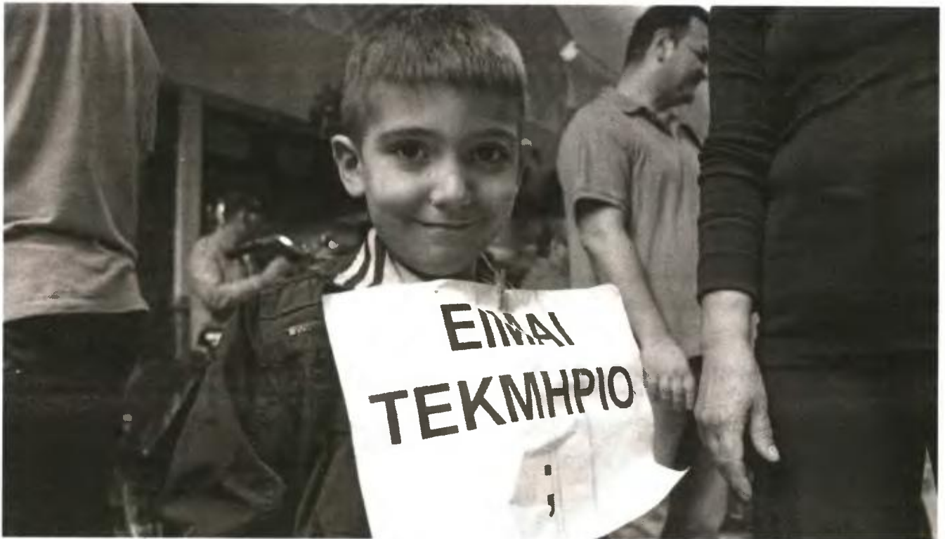
Διαμαρτυρία πολυτέκνων στην Κατερίνη